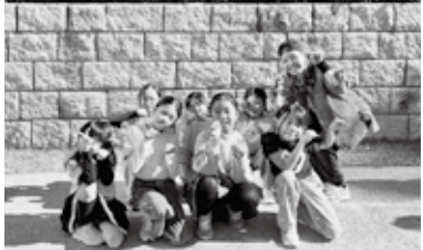
2年生が2人新加入しました！