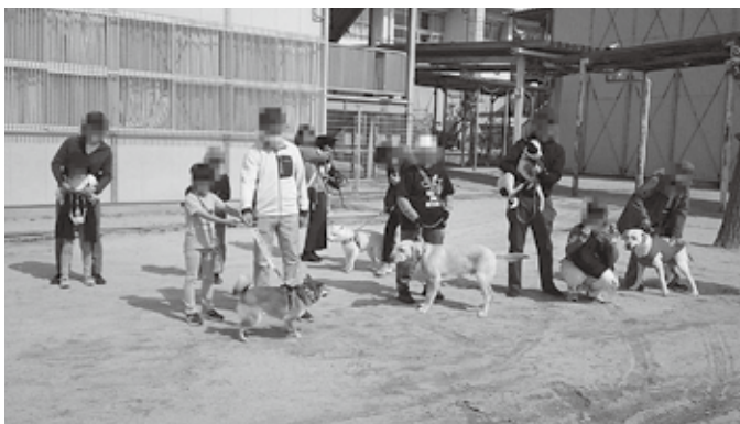
アットホームで楽しい会になりました

わんわんパトロール隊・ひろたの連絡会が、3月28日 に広田小学校中庭で行われました。いつもはおのおので 活動していますが、飼い主も犬も交流を深められた良い 機会になりました。今後も、年に1度の連絡会を予定し ています。