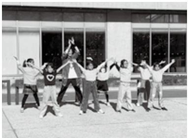
こどもフェスタ出場(六湛寺公園)

地震用マイ・タイムライン(災害時にいつ何をするか、自分自身の逃避行動計画)を作りました。配布された用紙は、行動計画のチェックリストになっています。