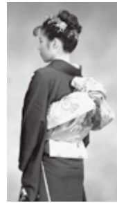
次女の成人式振袖 我・渾身の着付

「ポリシータかめいきいきライフ」は、趣味として楽しみながらも 専門的な知識や技術を生かして、活動する地域の人による寄稿文です。