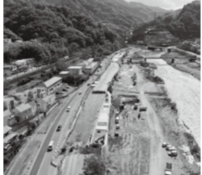
写真奥は名塩、右手は武庫川、左手は現道路

国道176号名塩道路は、交通渋滞の解消、交通安全の確保、及び異常気象時の交通確保等を目的に4車線化を進めています。 現在、生瀬トンネル東側で道路を広げるために、武庫川に張り出す橋の工事を実施しています。 張出橋の完成後、張出部に交通を切り替え、現道を高くする工事を進めていきます。 工事に伴い、西宝橋南詰交差点周辺の現道部や生瀬通りで、片側交通規制などを行う時期がありますので、ご理解とご協力をお願いします。