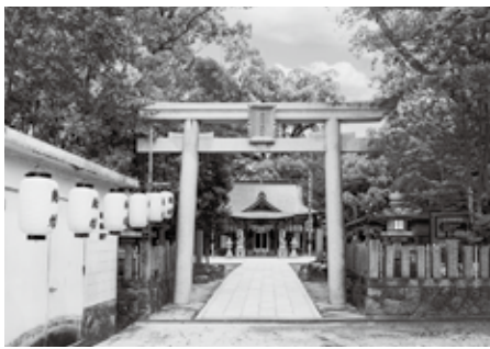
新しくできた大鳥居から本殿に続く石畳

これまで、本殿大修理、大鳥居再建、末社移設改修、手水舎改修などを行ってきましたが、このたび、氏子会50周年事業として境内の敷石を整備しました。従来は、雨の日や雨上がりの日には水たまりやぬかるみが多く、参拝に不自由をかけていましたが、大鳥居から本殿、さらには末社へとつながる参拝経路に石畳を敷いたことで「お参りしやすくなった」と喜んでもらっています。