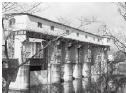
ダムの下流に多自然型魚道があります

「自然の水族館」では、魚道側壁の観察窓から魚類の遊上状況などが確認できるようにしており、魚道の仕組みなどを学ぶことができます。毎年7~10月までの間、一般開放しています。事前の申し込みは不要なので、夏休みなど見学に行ってみませんか。(広報)