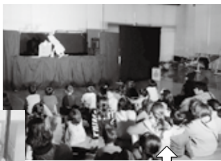
人形劇サークル「うりぼう」『ワニくんのめざましどけい』など、子どもの喜ぶ人形劇をたくさん上演