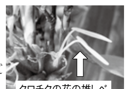
↑ クロチクの花の雄べ

竹は稲や麦、トウモロコシの仲間です。江戸時代に中国から渡来したクロチクは、茎(植物学では稈)は1年目は黄緑色で、2、3年で黒くなります。また、ハチクの変種であり、開花周期がハチクと同様120年といわれています。 わが家のクロチクは、直径2cmぐらい高さは5mぐらいで、タケノコは、始めてから5カ月ほどで親指ぐらいの太さの成竹になります。 2月の終わりごろに庭の整理をしようと、ふとクロチクを見たところ、今までに見たことのない物が付いているのを見つけました。ネットで調べると、これは120年に1度咲く花とのことでした。 この珍しい現象を皆さんに見てもらおうと、竹を切って道路から見やすい場所に置くと、通りがかりの人々や知人も見に来て、