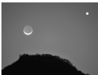
三日月と金星(イメージ写真)

夏休み中には「ペルセウス座流星群」が見られるので流星を見るチャンスです。流星群が一番多くなる「極大」の予報が8月13日の午前11時ごろなので、12、13日の夜が狙い目です。流れ星は明け方によく飛ぶので、13日の夜明け前が一番多くなります。 地上からの明かりが少なく、星の良く見える方向を眺めていけば、5分に1個くらいは見えるでしょう。明るい流星が飛んだ後には、飛行機雲のような光芒が1秒から数十秒見えることがあり、これは「流星痕」という現象です。