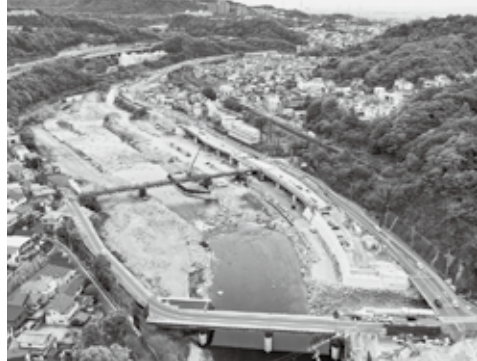
写真奥は宝塚、手前の橋は仮西宝橋(車道)

また、生瀬トンネル周辺の武庫川側斜面において、切土工事を実施中です。事業完成後は、生瀬トンネル側が三田方面の2車線、現在、切土工事を行っている現道側が宝塚方面の2車線の計4車線道路となります。 (兵庫国道事務所)