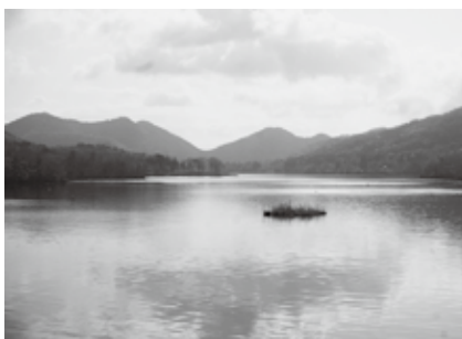
釣り人用のレンタルボートもあります

青野ダムには、魚が上りやすい川づくりなど、水環境改善の一環としてダムの上流と下流をつなぐ「多自然型魚道」や魚道の観察施設「自然水族館」を整備しています。