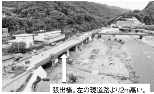
↑ 張出橋。左の現道路より2m高い。現道路を高くする。

国道176号名塩道路は、交通渋滞の解消、交通安全の確保、及び異常気象時の交通確保等を目的に4車線化を進めています。 現在、生瀬トンネル東側で道路を広げるために、武庫川に張り出す橋の工事を実施しています。 張出橋の完成後、張出部に交通を切り替え、現道を高くする工事を進めていきます。 工事に伴い、西宝橋南詰交差点周辺の現道部や生瀬通りで、片側交通規制などを行う時期がありますので、ご理解とご協力をお願いします。