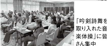
舞を音に皆集中 「吟剣詩舞を取り入れた音楽体操」