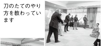
刀のたてのやり方を教えています

私はこの町で生まれ育ち、この町に非常に愛着を持っています。皆さまがこの町に住んで良かったと思えるような地域づくりを目指して、精いっぱい努力する所存です。会員の皆さま並びに役員一同のご支援とご協力を心よりお願い申し上げます。