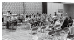
軽快な吹奏楽で会場の雰囲気も盛り上がります