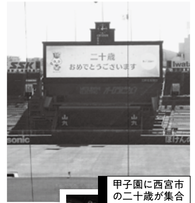
甲子園に西宮市の二十歳が集合

普段と違うりりしいスーツや華やかな振り袖で着飾った式典の様子を多くの写真で一挙紹介。「子どもの時と変わらないね〜」「この子、誰？」などと、家族で盛り上がってください！