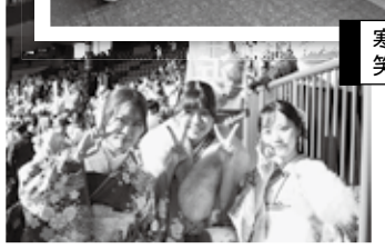
寒い中でも 笑顔でピース！