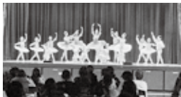
華やかな衣装と踊りが素晴らしいパレエ