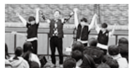
ステージ祭をきっかけに結成 HAMAKKO BAND +