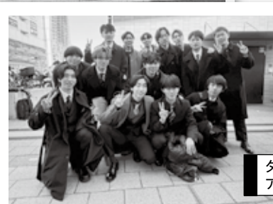
タイガースチームショップ アルプス前で記念撮影!