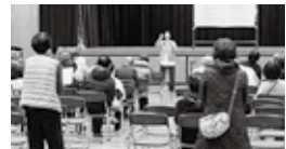
最後は全員で定番の『ピリール』を合唱