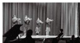
MJOがオープニングを担当しました