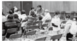
観客参加型のプログラムでは会場が一体に