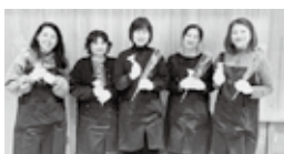
サプライズの花贈呈もあり、笑顔で集合写真