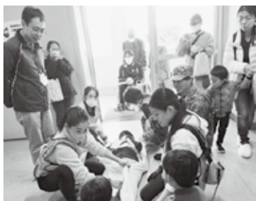
まちの減災ナースチームと住民、市職員、自衛隊が協力してシーツ担架で搬送する様子

自助、共助に公助も加えて、地域全体が一体となって命を守る行動を体験する機会となりました。(渡辺)