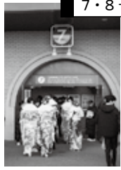
入場は 7・8号門から