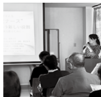
まちの減災ナース活動講話を聞く参加者

日頃から地域のつながりを育み、医療と地域が連携して備えることの大切さを改めて考える機会となりました。(渡辺)