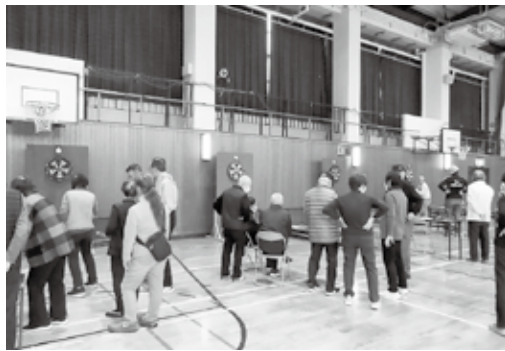
開始をワクワクと待っています

冬の恒例になっている「ボードダーツ大会」。1年に1回の開催のため、ぶっつけ本番の参加者が大半ですが、皆さん楽しみにしていたようです。簡単に見えてなかなか思うようにいかないのが、このゲー