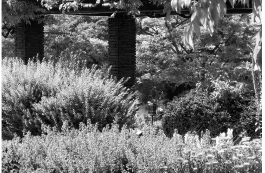
公園は緑いっぱいです(東三公園)