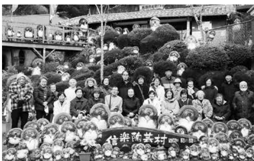
たくさんタヌキに囲まれて

「古の色を見て内臓の具合を知る」など、いろいろと学びました。つば押しのは「痛気持ちいいが一番!」とのこと。「元気で楽しく長生きを。感謝の気持ちを忘れないで」との先生の話に、皆さん納得していました。