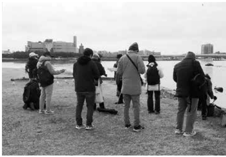
浜では熱心に観察