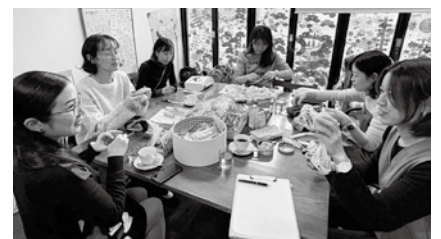
おしゃべりからアイデアが生まれることも

今回は穴の空いた靴下やジーンズ、鍋つかみなど、縫い方を教わりながらリペアしました。捨てると思っていたものも、リペアカフェがきっかけで「これも直せる!」と気づくことも。集まったメンバーは補修するうちにアイデアが生まれ、毎回楽しみが増えるとか。「補修するだけでなく、刺しゅうや編み物も!」と盛り上がっていました。