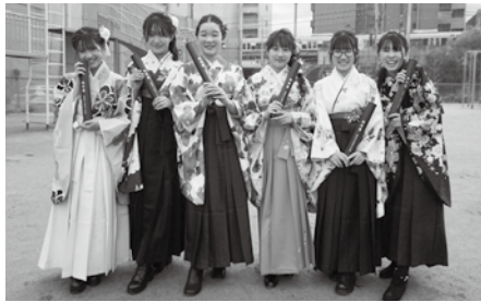
卒業式を終えて、友達と記念撮影