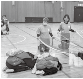
アラートで地震が来ると、机の下で待機し、地震が収まるまで待機します