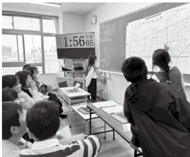
手書きの地図を貼って分かりやすく説明

「地震博物館」というだけに、地震や防災についてさまざまな視点から研究されていました。写真やタブレットを見せたり、クイズを出したりと工夫もあり、参加した大人も熱心に聞いていました。