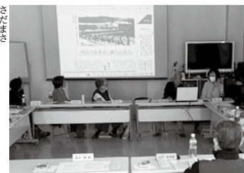
創立間もない頃の安井小学校が掲載されている「わがまち安井」創刊号(昭和54年10月発行)をスライドで紹介

昭和54(1979)年に創刊された『宮っ子』が、3年後に50周年を迎えます。安井地域コミュニティ協議会の有田