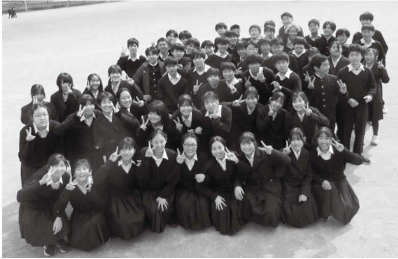
卒業を前に安井っ子大集合!