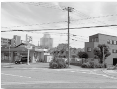
③ コンビニへ出入りする車に注意