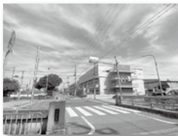
① 交通量の多い中津浜線の交差点

通学路の危険箇所などを、春風小学校、PTA愛護の協力を得て、マップとしてまとめました。