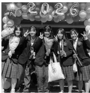
忘れられない1日になりました

運動場や中庭付近では先生や保護者が出迎え、吹奏楽部の演奏が流れる中、生徒たちは友人や先生と言葉を交わしながら、思い出の学び舎を後にしました。新たな道へと歩み出す77期生の今後の活躍が期待されます。