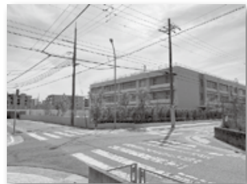
④小学校周辺は朝夕の登下校時間帯に混雑