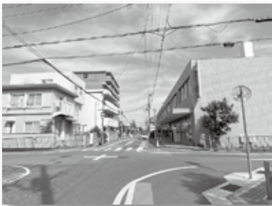
② 郵便局周辺の駐停車車両に注意