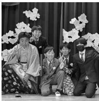
笑顔弾ける撮影タイム

その後は、体育館で記念撮影タイム。先生や友達と一緒に、楽しく別れの時間を過ごしていました。