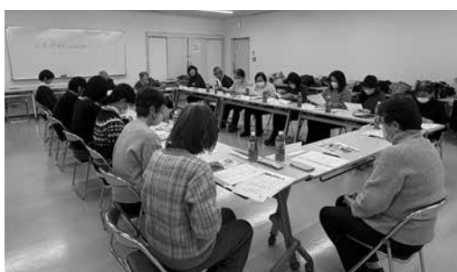
今津地域、津門地域の編集メンバーとの懇談会に参加

「春風地域のことを知って、もっと好きになってもらいたい」メンバー一同、その思いを持って誌面作りに取り組んでいます。