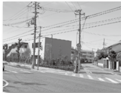
⑥見通しの悪い交差点