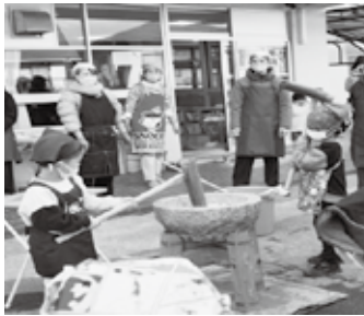
「きねって重いね！年中さんも見ているから頑張ろうね」

餅をつくのは年長児だけで、昨年は応援をされていて先生から「年長になつたらつこうね」と言われていました。今年も、その最年長として餅をつけます。うれしくてはしゃいでいる子や恥ずかしそうな心配顔の子ともいました。