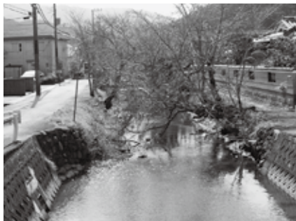
水門を出て武庫川へ注ぐ

その源流は真南条川と田松川の合流よりも下流とされ、篠山市丹南にあります。三田市を通り、渓谷を下り、阪神市街地を流れて大阪湾に注ぎます。その全長はおよそ66kmにもなります。生瀬地域は、その下流域の入り口に当たります。