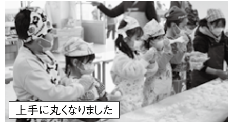
上手に丸くなりました

最初は、蒸し上がったもち米をひとさじずつ口に入れてもらい、試食をしてもちもちとかみ「甘くなってきた」と味わっていました。その後、大人が餅を少しつき、子どもに交代です。子ども用のきねを持ち、2人ずつでつきます。周りで見ているみんなが「よいしょ、よいしょ」と応援をしてくれました。子どもにとっては重いきねですが、頑張っていました。つき上がると部屋で、先生がちぎった餅をみんなで丸めます。温かくて柔らかな感触を楽しんでいました。