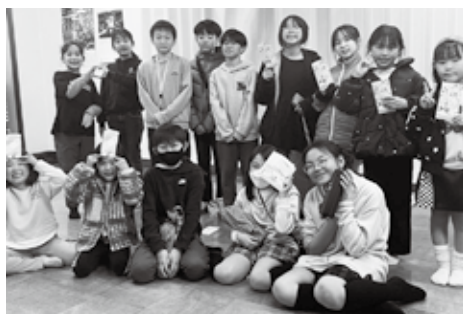
卒業おめでとう!! 進級おめでとう!! さらに大きくジャンプしてね!

どこかうれしそうな様子で受け取ってくれます。その時、小さい頃から一緒に活動してきた子どもたちの成長した姿に、役員一同は感慨深い気持ちになり、新しいステージへ進む6年生を感謝とエールを込めて送り出します。また、6年生以外の子ども