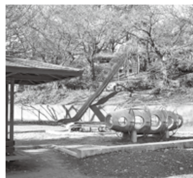
地形を利用した長いすべり台は豊楽公園のシンボル

入った所には、いろいろな教室のちらしが設けられています。 向かって伸びていく町です。まず、越木岩会館へ立ち寄りましょう。越木岩地域の住民に親しまれ、さまざまな団体の集まりなどで使用されているこの会館は、空手やヨガ、習字の習い事などに使われています。 越木岩会館西側の道を進み、横目でキリスト教会を眺めながら坂道を左へ歩いていくと、元マムシの巣の豊楽公園が現れます。この公園は地形を利用し、2段構えになっています。下は広いグラウンドと遊具があり、学校帰りの子どもたちのにぎやかな声が聞こえてきます。また、土曜