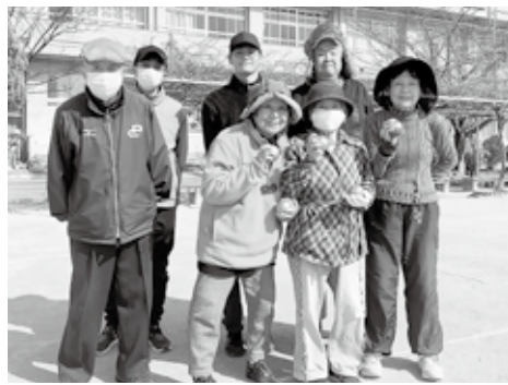
はじける笑顔が最高です

コートの中でひととき元気に球を投じるのは、御年90歳を超えるベテラン選手で、かつて全国大会で優勝した経験も持つ実力者です。今も、週に数回はコートで若手メンバールと汗を流しています。