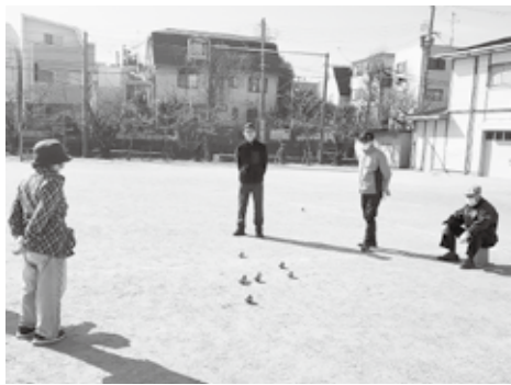
初心者も楽しめます

「若い子はすぐに上達するし、ベテランは地面を読むのが上手だね。子どもから高齢者まで、世代や年齢を超えて一緒にプレーできるのが、この