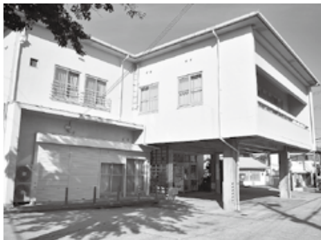
来年3月に建て替え工事が始まる越木岩会館

豊かで楽しい町と書く「豊楽町」。何だか幸せそうではない町名だと思われるかもしれませんが、実はちゃんと意味があるのです。 かつて、この辺りには東西に二つの小山がありました。東の小山が、お茶などをいれる底の浅い素焼きの土鍋「焙烙」を伏せたような形をしていることから、焙烙山と呼ばれていました。豊楽町はその山に由来する町名とのことで、縁起がいいのでこの漢字を当てたのかもしれませんが。