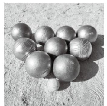
目印のビュット(手前)とボール

地域での練習に加えて、芦屋市や淡路市、時には岡山まで交流試合に行くそうです。試合の前には懇親会も開催され、遠方のペタンク仲間との思い出も宝物だそうです。「ここに来れば、仲間とおしゃべりもできるからうれし