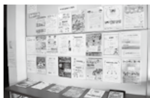
入り口にはさまざまな教室などのちらしが置かれている

100年ほど前には、豊楽町周辺には民家が約10軒ほどしかなく、周りは田畑ばかりだったそうです。また、豊楽公園の辺りは、その頃は谷が深く、マムシの巣だったそうですが、住宅が立ち並び、車が行き交う今の姿からは想像できません。 では、少し歩いてみましょう。豊楽町は、越木岩会館から北へ、越木岩神社の方向へ向かって伸びていく町です。まず、越木岩会館へ立ち寄りましょう。越木岩地域の住民に親しまれ、さまざまな団体の集まりなどで使用されているこの会館は、空手やヨガ、習字の習い事などに使われています。