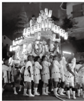
夜道に浮かぶだんじりの灯り

日には、ペタンクをする元気なシニアたちの姿も見受けられます。公園の上側は藤棚やベンチがある住民の憩いの場所、春には見事な桜が咲き、皆さん敷物を広げてお花見を楽しんでいます。 豊楽公園を後に、坂道を登っていくと越木岩神社があります。途中まで登ると、美作町、西平町、桜町との4町の境が、まるでアメリカの4州が直角に交わるフォー・コーナースのような交差点となっており、豊楽町はここまで終わります。 この越木岩神社へ続く道は、9月のだんじり巡行の最終日の夜に、神社とだんじりが2台引かれていきます。坂を上るだんじりは、闇の中から浮かんで現れ、その幻想的な風景は、祭りの終わりを感ぜさせ、少し切ない気持ちになります。 今年の秋分の日には、だんじりを見送りに行きませんか。