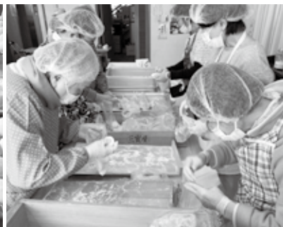
丸める手つきも鮮やかです