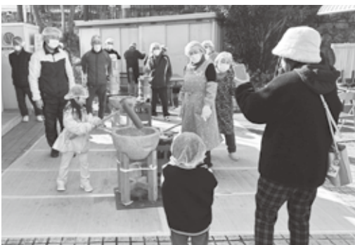
子どもたちも一生懸命です♪