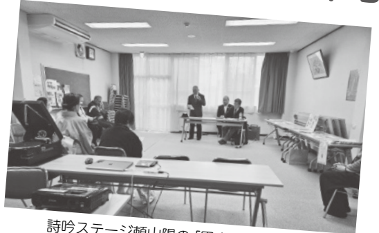
詩吟ステージ頼山陽の「甲山」などを披露(1階会議室)