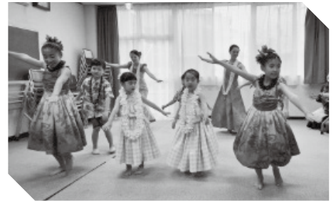
西宮フラサークルのフラダンスステージ(1階会議室)

日頃、市民館を利用している団体やグループの活動を紹介するための催しが、2月11日に開催されました。1階会議室では「宮っ子音楽回廊」によるスクリーン上映。2階和室ではひな飾りや香道具展、大人書道展、五目ならべ、『宮っ子』展示などがありました。