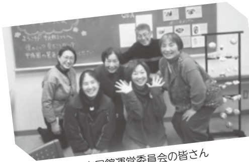
市民館運営委員会の皆さん