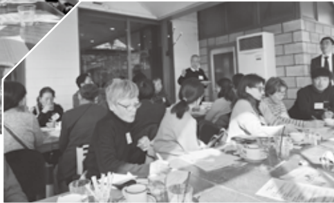
各グループに分かれて討論

アの現状は人手不足など深刻な課題があり、今から対策を講じなければ、地域ボランティアの未来は危機的状况となるのではないかと意見も発表されました。 少しでも地域ボランティアの輪を広げられるように、今後ともみんなで楽しく活動していきたいと確認しました。