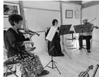
3人の息の合ったハーモニー

甲陽園目神山町の「やまびこの家」で、3月5日にやまびこ会シニア会がご当地ユニット「ロケットナ」を招いて室内楽コンサートを行いました。バイオリン、ピアノ、フルートのユニットの奏でるメロディーに参加者約30人が魅了され、早春の午後を楽しみました。