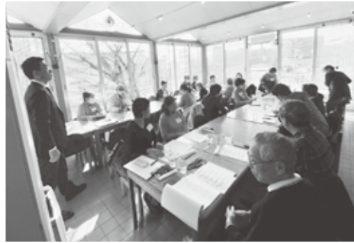
今年度も活発に意見が交わされました

甲陽地域コミュニティ協議会主催の地域懇談会が、新甲陽町の中寿美花壇で1月17日に開催され、地域ボランティアに携わる約30人が参加しました。 まず、昨年の地域懇談会で話し合った地域ボランティアの現状と課題のまとめを報告しました。その後、グループごとに地域ボランティアの未来について意見を共有し合い、交流を図りました。活発な意見が交換され、大変盛り上がりました。しかし、地域ボランティア