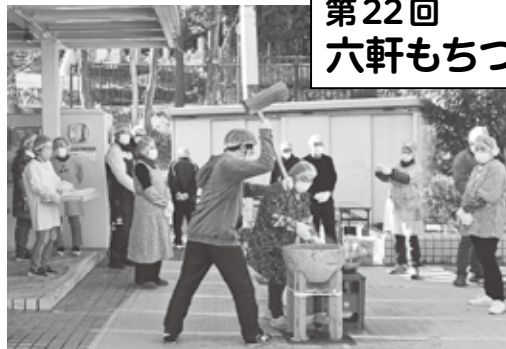
伝統のもちつき大会は今年もにぎわいました