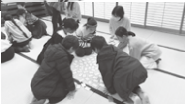
本番を待つ子どもたち