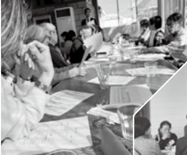
熱心にメモを取る参加者

甲陽地域コミュニティ協議会主催の地域懇談会が、新甲陽町の中寿美花壇で1月17日に開催され、地域ボランティアに携わる約30人が参加しました。 まず、昨年の地域懇談会で話し合った地域ボランティアの現状と課題のまとめを報告しました。その後、グループごとに地域ボランティアの未来について意見を共有し合い、交流を図りました。活発な意見が交換され、大変盛り上がりました。しかし、地域ボランティア