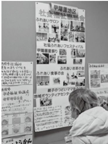
甲陽園地区社会福祉協議会の展示

日頃、市民館を利用している団体やグループの活動を紹介するための催しが、2月11日に開催されました。1階会議室では「宮っ子音楽回廊」によるスクリーン上映。2階和室ではひな飾りや香道具展、大人書道展、五目ならべ、『宮っ子』展示などがありました。