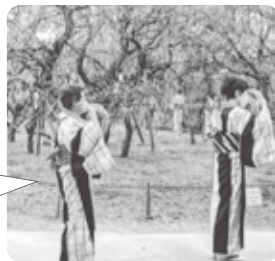
甲東民踊グループ 2月28日 「梅びらき民踊の集い」