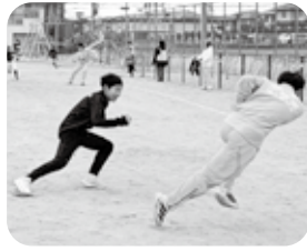
最後は児童がハンター役に