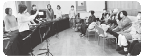
トーンチャイムを楽しむ会 3月2日 「トーンチャイムの公開練習と体験」