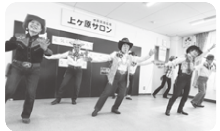
バンダナや大きなバックルのベルトもおしゃれ

初体験の参加者からは「初めての催しで楽しかった。~また来てな~」「知人が踊っていて偶然、再会できました」との感想が聞かれました。