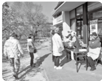
三味会 2月21日~23日 「ぜんざいの調理と販売」

体験会は、『となりのトトロ』『おしゃべりきかんしゃ』『小さな世界』の和音を振り、慣れてきたら、『春が来た』をメンバーと一緒に演奏しました。また、『手のひらを太陽に』を即興で歌ったり、ゲームをしたりして、交流を深めました。みんなで曲を作り上げるトーンチャイムは、大きなオルゴールのような響きでした。