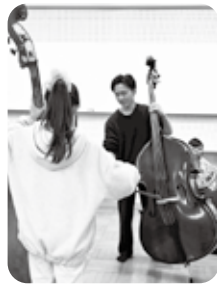
コントラバスを初体験

参加した保護者から「知りたかったことが聞けました」との声や、小学生児童から「いろいろな楽器を吹けて、やりたい楽器が決まりました」などの感想がありました。