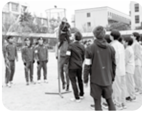
かわいいハンターさんを持ち上げて玉入れ

2学年ごとの3部に分け、児童は逃げるだけでなく、学年に合ったミッションを与えられます。宝箱を見つけてハンターを停止させたり、玉入れ対決をしたり、捕まっても大縄を跳ぶと解放されるなど、楽しい工夫が用意されていました。ハンター役は保護者だけでなく、関西学院大学陸上競技部10人と市立西宮高校陸上競技部12人が務め、スタッフとして、保護者、上ヶ原地区社会福祉協議会、スポーツクラブ21うえがはら、上ヶ原地区青愛協、安全を守る会が協力して安全最優先に見守りました。