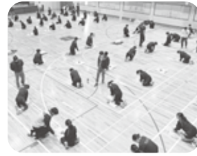
正しく押すと音が鳴ります