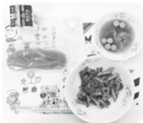
ベンネのミートソース、パン、牛乳、コンソメスープ、ひとくちチーズ