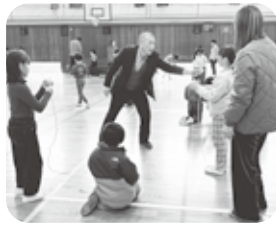
校長先生、コマ回し上手

この行事は令和6年度から「コミスクうえみな」が引き継ぎ、今回で2回目です。前回から保護者の参加が増え、未就学児も6人が参加。入学前に西宮市のおいしい給食を味わいました。