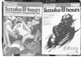
雑誌に載る人たちと同じレースに出る幸せを味わいました

「鈴鹿サーキットで走りたい!」と思い、18歳で125ccのバイクに乗りました。練習で六甲山へ走りに行くうちに、腕試しにとサーキットへ行くようになり、菅生、鈴鹿、筑波などいろいろなサーキットで走りました。サーキットはよく整備されて安全なんですよ。月2回の練習で、抜かれたり抜き返したりするうちに上達してレースに参加するようになり、全44台の中で1桁台を目指しました。最終的に750ccで走り、平成元年のレースを最後に引退しました。