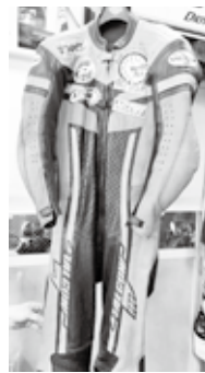
自身を守ってくれた5kgあるライダーズーツ

「レースで身に付いたことは? レースに出場する中で、エンジンから始まり、バイクの組み立てや走った後の故障修理を自分ですることで、スキルアップできたことが一番の成長かなと思います。『好きなこと』のための努力なのでレース前日でも気付けば夜半までバイクをいじっていました。何よりも、ボランティアで手伝ってくれる友人たちの協力がなければレースに出られません。ガス欠や転倒、けがはつきものですが、みんながピットで待っていると思うと帰れるんです。その頃のつながりは一生ものです。」