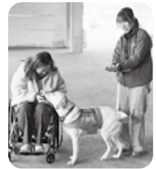
介助犬リーフとのふれあい

体験会では、訓練士とサポーターが広報PR犬のリーフ(ゴールドンレトリバー・オス3歳)と、手足の不自由な人や車いすの人をサポートする介助犬の実演をしました。週1~3日の部活動では、フードや掃除などの後にPR犬とふれあいます。慣れてきたら、シャンプー、爪切り、ブラッシングの手伝いもするそうです。