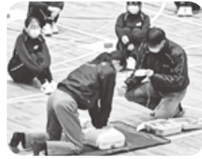
救急隊員によるデモンストレーションを見学

救急隊員は「倒れている人がいたら勇気を出して声をかける」「自分にもできることがあることを知る」「命のバトンをつなぐ1人になる」と、分かりやすい言葉で説明しました。