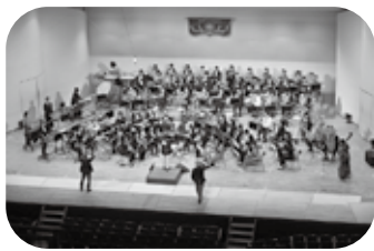
OB・OGバンド・当日リハーサルの様子

(※アンケートは、定期演奏会に参加した70期('19年卒)~76期('25年卒)の卒業生を中心に行いました)