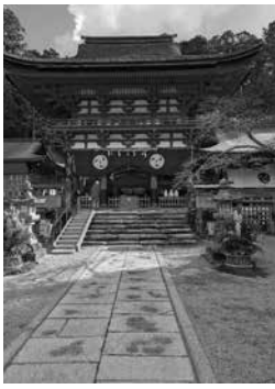
丹生都比売神社 (にゆうつひめじんじゃ)

昨年11月29日に春風小学校で防災訓練が行われました。快晴で暖かな天気にも恵まれ、皆さんの親子連れや地域の人が参加し、楽しみながら防災について学びました。