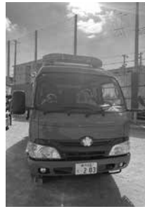
消防車にも乗れたよ!

ずらりと勢ぞろいした消防車は圧巻で、警察車両や給電車の展示もありました。実際に活躍中の砂にまみれた自衛隊車に、制服を着て乗車できる体験などもあり、子どもたちは大喜びでした。