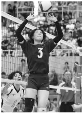
躍動する姿がまぶしい

中学当初はミドル、ライト、レフトなどポジションが変化しましたが、3年生になってセッターに挑むようになり、今では名セッターとして全国にその名をとどろかせるようになりました。