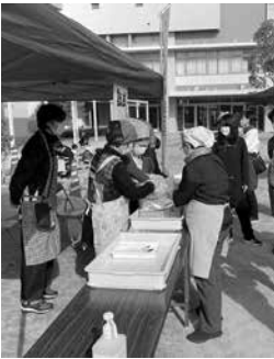
災害時には食が大事

災害食「アルファ米」の試食コーナーもありました。春風自主防災会の皆さんが提供する山菜おこわは、もっちりとして食べ応えがあり、火を使っていないことが信じられないほどおいしかったです。被災した際に重要な応急給