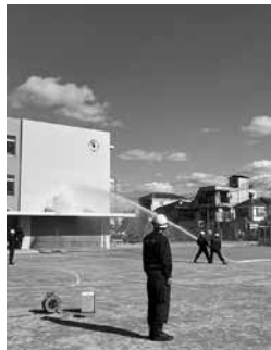
校舎を放水がめがけて消火! 迫力ある放水が校舎を

訓練の締めには消防団による放水訓練の実演がありました。消防団の人がキビキビした動作と掛け声でホースをさばき、校舎に向かって放水する様子は頼もしさでいっぱいでした。