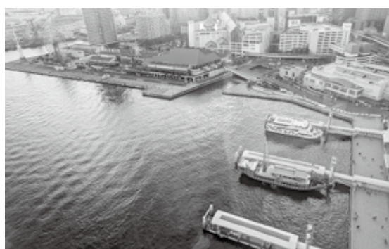
屋上デッキからの眺めも最高

★参加者の声より ・シーワールドは2時間では足りないくらい楽しかったです。リニューアルされ、気になっていた施設に行けて本当に良かったです(近くでもなかなか行く機会がなかった)。 ・食事もおいしく全てが楽しかった。天候にも恵まれ、気になっていたスポットを巡ることができた今回のツアーは、生き物たちからたくさん元気ももらえた。