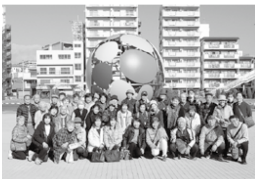
44人の記念写真。みんな笑顔です♥

続いて訪れたオルカスタジアムでは、親子のシヤチ(ステラとラン)によるスケールの大きなパフォーマンスが披露されました。力強く泳ぎ回り、大ジャンプやスピン、ト