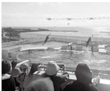
イルカの大ジャンプ

最初に向かったのは、神戸市立須磨海浜水族園跡地に一昨年6月に開業した「神戸須磨シーワールド」です。館内には「アクアライブ」「ドルフィンスタジアム」「オルカスタジアム」の3エリアがあり、どこも見どころがたっぷり。アクアライブでは、前身の水族園から引き継いだ生き物も含めた522種、約1万7千点が見やすくなった水槽