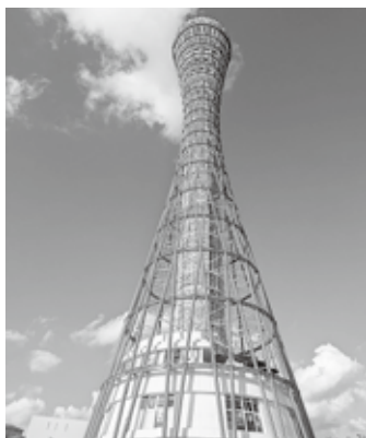
下から見ると圧巻です

その後、イルカのショーが行われるドルフィンスタジアムへ。須磨の海を背景に、トレーナーと音楽に合わせて繰り上げられる迫力満点のパフォーマンスに、遠足で訪れていた子どもたちや観客から歓声が上がりました。大ジャンプやダンスのパフォーマンスなど、愛嬌あふりのイルカに、多くの人が時間を忘れて見入っていました。