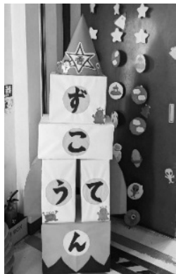
どこかに校長がいるよ

「香櫨園駅の特徴は何ですか」 香櫨園駅のホームには、扉を開けるとテラスに出られる所があり、春になると満開の桜を見ることが出来ます。また、階段の途中にステンドグラスがあり、趣のあるおしゃれな駅としても有名です。 香櫨園地域は、普段は閑静な住宅地で、桜の名所としても素晴らしい