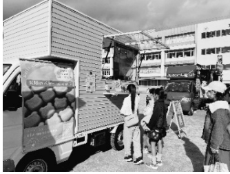
かわいいクマのベビーカステラ

地域内の老人クラブ連合会や環境衛生協議会、民生児童委員協議会、各町子ども会、PTA、甲陽学院中学校、香風高校、大手前大学、YMC Aなどさまざまな年齢層のスタンプがまつりを通じて共に楽しみ、子どもたちと触れ合いました。地域のつながりが感じられた1日となりました。