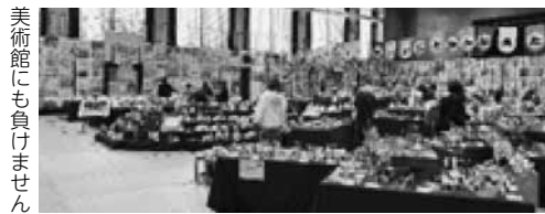
美術館にも負けません

どの作品も「こんなものがあつたら良いな」「こうしてみようかな」など、「いいこと考えた!」のアイデアがあふれていました。それぞれの作品に、子どもたちの成長と豊かな発想力を感じられたことでしょう。