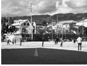
風が吹いてよく上がるたこあげ

運動場では唐揚げ、フランクフルト、カレーなどのキッチンカーが出店。おもしろいな匂いが漂う中、子どもたちがダンスやたこあげをして、笑顔で体を動かす姿が見られました。