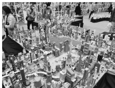
「段ボールの街」のテーマの下、みんながつながって一つの街に

平面作品の絵画は、どの学年も画用紙いっぱい描かれています。サーカスがテーマの3年生はさまざまなポーズを取った色鮮やかなピエロたちを、今にも動き出しそうな躍動感で描いていました。