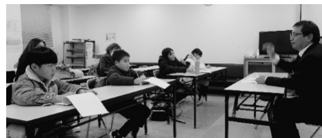
いろいろなエピソードを交じえた話を聞きました

月、現場で師匠(指導係員)について約1カ月の見習期間があります。その後、試験に合格すれば正式に「駅掌」として働くことができます。そして車掌や運転士も同様です。まず、登用試験に受かった後、教習所で車掌は約2カ月、運転士は約4カ月間勉強します。その後、実際に師匠(指導車掌、指導運転士)について電車に乘務しながら勉強する見習期間があります。運転士になるには、全部終わるまで約8カ月かかります。 —運転士の仕事と本社の仕事はどちらが大変ですか どちらも大変です。運転士は多くの人の命を預かっている。「事故を起こさない」ことが重要です。朝も早いので眠たくならないようにしっかりと睡眠をとるように気を付けていたり、朝ご飯をおなかいっぱい食べないようにするなど、いろいろなところに気を遣って運転しています。