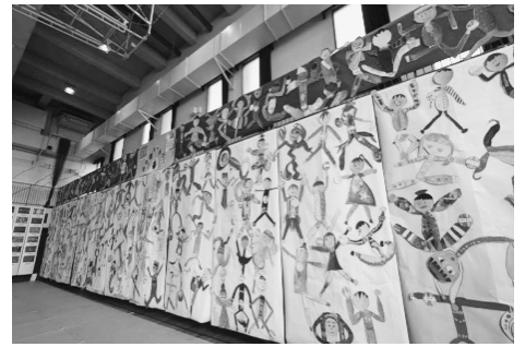
今にも動き出しそうなピエロたち

どの作品も「こんなものがあつたら良いな」「こうしてみようかな」など、「いいこと考えた!」のアイデアがあふれていました。それぞれの作品に、子どもたちの成長と豊かな発想力を感じられたことでしょう。