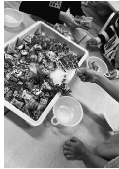
お菓子すくいでたくさん取れたかな？

校舎内ではお手玉、百人一首、バルーンダンス、ストラックアウト、大型紙芝居、あやとり、おはじき、囲碁、将棋などたくさんさんのブースがありました。子どもたちは思い思いに巡って楽しみました。