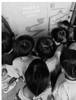
ピタゴラ装置みたい!

香櫨園小学校の香風館で、昨年11月17〜22日に、図工展が開催されました。今年の大テーマは「いいこと考えた！」。