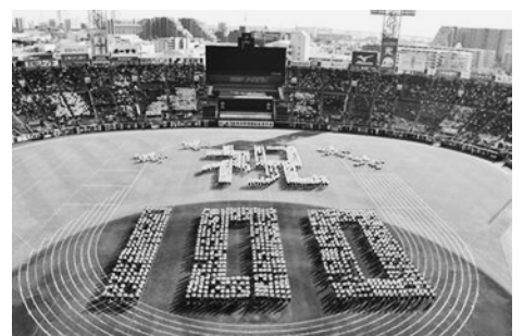
3・9年生女子による人文字

ムの最後に披露された3・9年生女子によるダンス「未来」では、市制施行100周年を祝う人文字が描かれ、観客から盛大な拍手が送られました。さらに校歌交歓では、浜脇中学校が今年も伝統の人文字を披露し、大きな拍手と歓声に包まれ、会場は感動に満ちた雰囲気になりました。(西宮浜義務教育学校は小・中一貫校です)