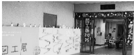
入り口には子どもに人気の先生手作りの看板