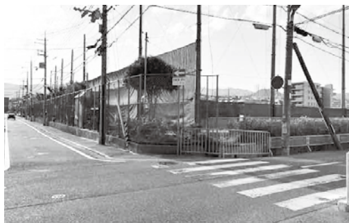
自転車の往来も多い道路です

陸上競技部 男子 400m 第1位 T.R 女子 走高跳 第3位 S.R 卓球部 男子 団体戦 第3位 剣道部 男子 準優勝 女子 第3位