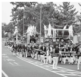
参道を練り歩くだんじり

安全に、安心して 校区内を歩こう⑦ 広田校区は広範囲で、児童が通学路として使用する道にも、危険な箇所がたくさんあります。危険箇所を知って安全に歩くことができますように、校区内の危険箇所を取り上げます。