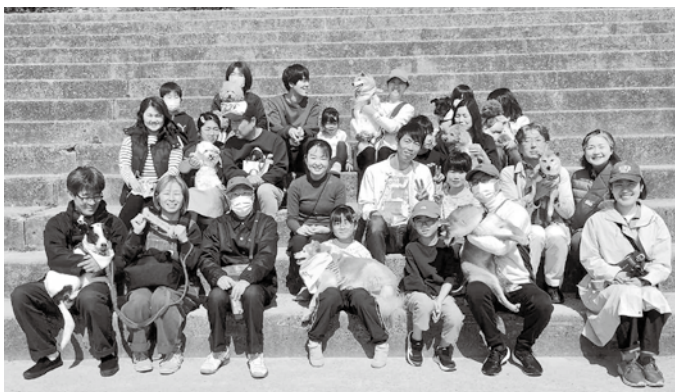
これからもみんなで地域を見守ります

わんわんパトロール隊・ひろたの連絡会が、3月22日に広田小学校校庭で行われました。いつもはおのおので活動していますが、飼い主も犬も交流を深められた良い機会になりました。今後も、年に1度の連絡会を予定しています。