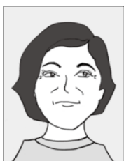
西宮まちなみ発見倶楽部代表 愛宕山自治会副会長

昭和35年、広田小学校に登校する児童と田畑が広がる風景。右側奥が西国街道