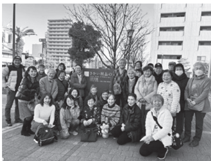
「さかい利晶の杜」の前で

冬空の寒い日でしたが、大切な命を守るための体験ができ、防災を深く学んだ貴重な1日でした。