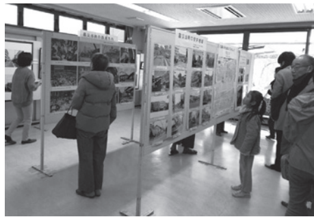
パネルを見る来場者

を記録したビデオを上映しました。防災の面からは「非常持ち出し品」や「備蓄食」などを紹介しました。