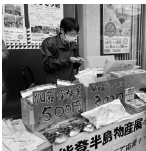
食べて応援しよう! 能登の物産品