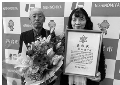
西宮市の教育功労者表彰を受賞し、夫妻で記念撮影。倒れるひと月前でした