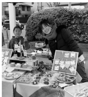
手作り小物の店も

フリーマーケット大盛況! 尼崎信用金庫西宮支店駐車場 (城ヶ堀町) 3/15 今年もフリーマーケットが開催され、たくさんの方でにぎわいました。 コーヒー、パン、野菜の他、子ども服や絵本など12店が出店。店先では見知らぬ客同士が一緒に説明を聞きながら、笑顔で品物を選んでいました。 前日の春の陽気から一転、冷たい雨が降り出し、午前中で打ち切られましたが、売る人も買う人も楽しんだひとりでした。