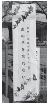
折り鶴をあしらった看板

阪神・淡路大震災から30年がたちました。たくさんの方に震災のことを知ってもらいたい、また、いつ起こるか分からない災害に備えるため、震災関連行事を催しました。