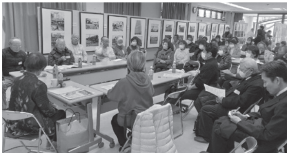
たくさんの貴重な話を聞くことができた座談会

震災が起こった瞬間は、「自分の体が回っていた」「トラックが突っ込んだか、飛行機が