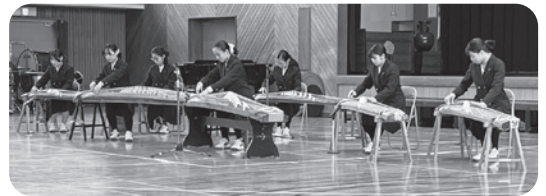
市立西宮高等学校箏曲部