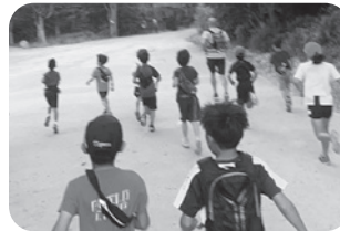
体力、精神力が強くなり、発散にも