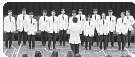
関西学院グリークラブ