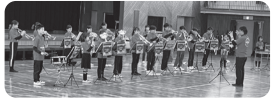
フレンドリーバンド