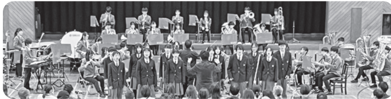
上ヶ原中学校コーラス部・吹奏楽部

市立西宮高等学校箏曲部による華やかな箏の演奏から始まり、小学生のフレンドリーバンド、上ヶ原中学校コーラス部と吹奏楽部、市西吹奏楽部、関西学院グリークラブと続くスペシャルな演奏会でした。観客はエネルギーに満ちたステージから元気をもらい、笑顔で会場を後にしました。