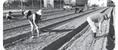
自分たちで育てたソバの味は格別です