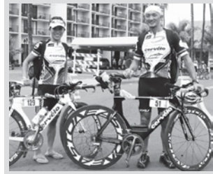
シドニー五輪から同じチームの夫妻