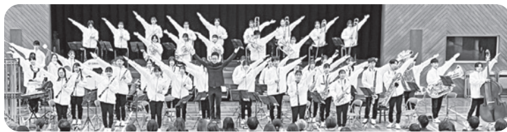
市立西宮高等学校吹奏楽部