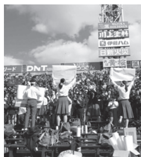
応援団を中心とした応援風景

光景は、一生忘れることはないと思います。人文字が完成した瞬間は、スタンドから自然と拍手が湧き上がり、「すごい！」という感情と「良かった！」というほっとした感情が混ざっていました。