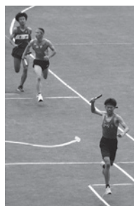
6×200mリレーで見事1位でゴール

最後に3・9年女子がダンスの後披露した「甲子園100」の人文字は、「圧巻！」のひとつことでした。節目の人文字を笑顔で担う姿がとても印象的でした。「みんなで取り組む楽しさ」や「達成感」、「喜びを分かち合える瞬間」を感じることができた中連体となりました。