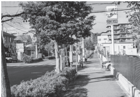
短いですが、往来が多い横断歩道です

今津西線レックスマンション北側の交差点。特に、能登運動場南側を西へ行く車両と、東側歩道を北へ行く自転車との接触事故が多いです。通学路でもあるため、交差点に入るときは、細心の注意が必要です。