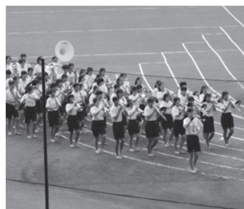
演奏しながら行進する吹奏楽部

熱くなりました。各校男子代表による競走競技6×200mリレーでは、本校代表の6人が見事1位を獲得しました。一致団結した応援で選手たちにエールを送り続け、一番でゴールした時は最高潮に盛り上がりました。