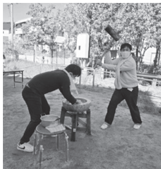
初めてとは思えないほど上手!

初めてもちつき大会に来た子どもは「お餅をついているところが見られて楽しかった。つきたてのお餅を初めて食べた」とうれしそうに言っていました。 大谷町親和会さくら会から参加していた男性は「普段にない経験ができ、楽しんできたかなと思います」と感想を寄せました。