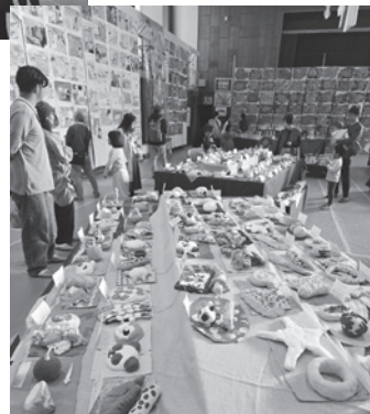
1年生 「ようこそ、すてきなパンやさんへ」

針金で制作した作品がライトの光できらきらと輝き、とても美しく映えていました。また、展示場所に置かれたタブレットでは、作品作りを頑張っている制作中の子どもたちの様子が紹介されていました。