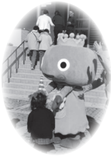
西宮市キャラクターのみやたんも参加

この日に学んだことを使わずに済むことが一番の願いですが、災害発生時にどのように行動するかを考える、貴重な1日になりました。