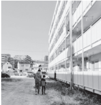
建物の周りもきれいにします

ヤトングを持ち、大谷町親和会（JR西日本社宅）の敷地内やその周辺での清掃活動に汗を流しました。当日は天気にも恵まれ、夫婦や幼い子ども連れ家族の参加もありました。