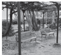
夏には日陰を作ります

藤棚の下のベンチに座り、ゆつくりと緑を鑑賞している人も見られます。緑が多く、鳥のさえずりが聞こえることもあり、夏休みには小学生がセミ捕りに来ています。