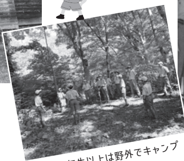
小学6年生以上は野外でキャンプ