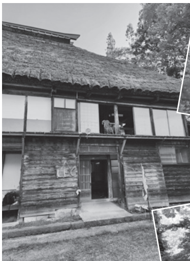
夏には長野のかやぶき古民家にお泊り！