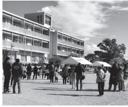
朝10時、夙川小学校校庭に集合！

市が小学校区で行っている防災訓練が、昨年11月23日に夙川小学校であり、約330人の地域住民が参加しました。