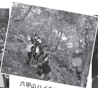
六甲山ハイキング