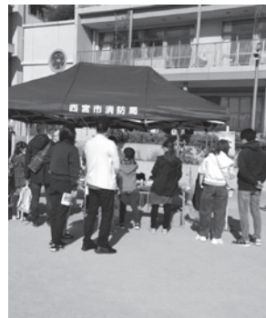
災害食レシピコーナー

写真撮影など子どもたちも楽しんで体験できる内容です。災害食レシピコーナーでは、ポリ袋で調理した「野菜ジュースで作るもちもち蒸しパン」を試食。おいしかったです！