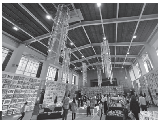
1~6年生の異学年グループ「きらめきグループ」の作品

夙川小学校の図工展が、昨年11月11~15日まで体育館で行われました。子どもたち一人一人が想像した「ものがたり」をテーマにした作品展です。