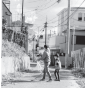
ごみを拾う親子連れ

毎年6月と12月に市内一斉に行われる「わが町クリーン大作戦」が、昨年12月8日に開催され、大谷町親和会とさくら会の声掛けでも行われました。 参加者は軍手をしてごみ袋