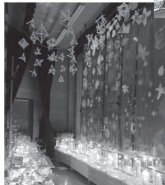
美しく輝く6年生の作品

体育館に入ると、会場いっぱい色とりどりの作品が広がっていました。躍動感があふれ、楽しい思い出や夢が描かれた作品の展示です。6年生全員による立体作品「光と場所のハーモニー」は、