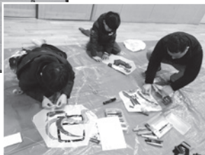
空に映える絵を描きます