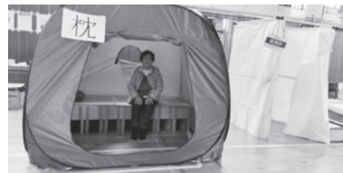
避難所体験で使われたテント

給水車も来て、ビニール袋へ給水の体験。また、夙川小学校北門付近の地中にある緊急貯水槽からの給水する体験もありました。