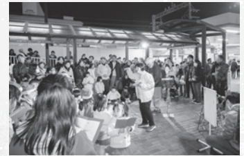
楽しそうに歌う子どもたち