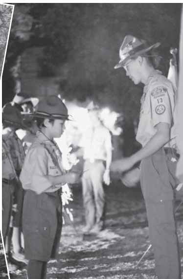
12月には越木岩神社で厳かに入隊式