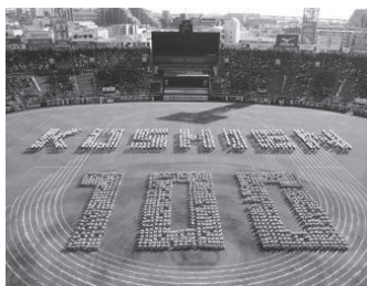
美しい芝と土の上に「100」の人文字が浮かびました

昨年11月8日、阪神甲子園球場で、第68回西宮市中学校連合体育大会が開催されました。甲子園球場100周年を記念して人文字が披露され、場内を沸かせました。