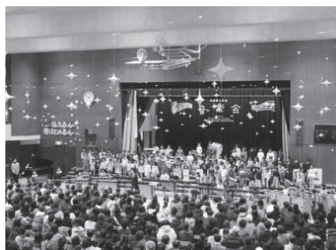
星の装飾がすてきな会場

秋も深まり、寒さも増した昨年11月30日、香櫛園小学校では音楽会が行われました。今年度の音楽会は、完全総入れ替えの4部制で、人数制限を設けて開催。会場は星の装飾で飾り付けられ、幻想的ですが大きな空間が広がっていました。