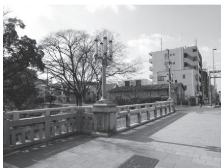
国道2号に架かる夙川橋（昭和元年架設）

先にあつたので、阪神国道のこの橋は「上夙川橋」と名付けられたといい、「天社村誌」には「夙川橋」「上夙川橋」と併記されています。 ちなみに、この橋を含めて夙川には4本の夙川橋があります。親柱や銘板に記載があるので、散歩の折にでも確認してみてくださいいかがでしょうか。