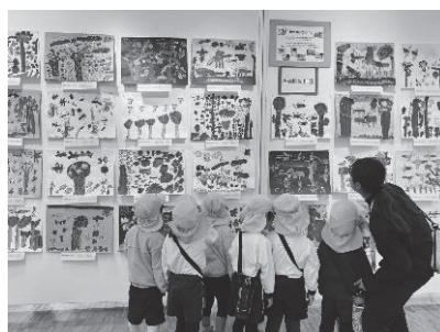
園児ののびのびとした絵画

子ども作品展 ホームページはこちらから https://kouoen-kodomoart.jimdostie.com/