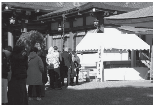
受け付けを待つ皆さん

当日は、氏子の人たちをはじめ、地域の子どもたちおよそ30人が参加。香櫨園地域からもたくさんの子どもたちが参加しました。また、数十年に1度の貴重な行事ということもあり、県外からも多数の人たちが朝早くから集まり、