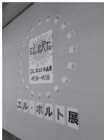
昨年のグループ展

活動しています。今年4月24～28日まで、中央図書館2階の西宮市立市民ギャラリーでグループ展を行います。同じモデルでも個性豊かな作品となっているので楽しめます。ぜひ、お越しください。