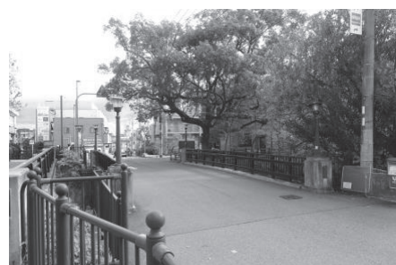
香櫨園駅南側に架かる夙川橋（昭和9年架設）