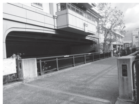
香櫨園駅南側に架かる夙川橋（平成15年架設）

神楽町の中央を国道2号が東西に走っています。阪神間は、明治から大正にかけて商業や住宅地として発展しましたが、阪神間をつなぐ主要な道路は現在の旧国道で、細く屈曲の多い道でした。拡幅しようにも、すでに道沿いに民家や店舗が軒を連ねていたことから、当時、まだ農地が広がっていた現在の国道2号辺りに新たな国道を通す案が計画されました。昭和元（1926）年12月25日、幅員27mの阪神国道（現・国道2号）が開通しました。 この国道2号の神楽町西端の辺りに「夙川橋」が架かっています。この橋は、かつて「上夙川橋」と呼ばれていました。同じ夙川に架かる西国国道の橋に夙川橋という名が