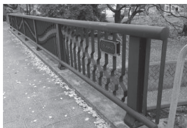
国道43号の北側と南側に架かる夙川橋（昭和35年架設）

参考文献 『町名と祭りの話』 山下忠男著 『町名の話』 山下忠男著 『西宮の橋梁』 西宮市教育委員会 『にしのみやデジタルアーカイブ』