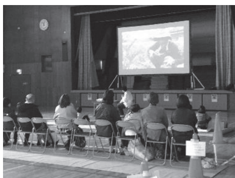
日本1周時の写真を紹介

自転車で日本を1周した時や芸人として活動していた時など、実体験に基づいた分かりやすく、面白い話で、子どもたちは話に引き込まれていました。