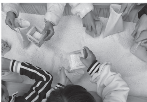
丁寧に袋に詰めます

神事を待ちわびる人々の行列が、社務所から表大門まで続くほどできていました。初めに地域の子どもたちが案内され、宮司から神事について説明を受け、おはらいを受けた後、清められた砂を袋に詰めました。