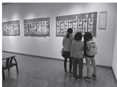
中学生のコンクール入選作品

作品の展示作業、期間中の受け付け、撤収作業など、地域の人たちの協力を得て開催されています。来年以降も、地域に親しまれる行事として定着していくことが期待されます。