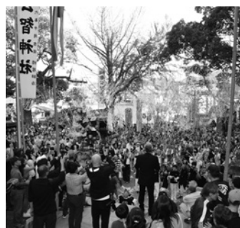
クラッカーの打ち上げ

秋祭りは地域の人が公智神社を中心に集まり、楽しく地域の祭りを共有できる機会です。次回も楽しみます。