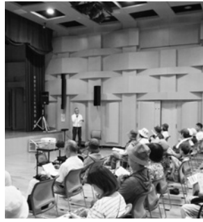
山口ホールでの注意事項説明

山口地域で開催された秋のイベント、「西宮山口腔ルキナーレ2024」が、10月12日の13時に幕が上がりました。