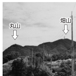
すみれ台(畑山を背に、左に丸山)

上山口地区では畑山をバックに丸山が見られ、すみれ台地区からの眺望は左に丸山、右に畑山の峰が見えます。なお、畑山山頂には通信用アンテナがあり、識別できます。