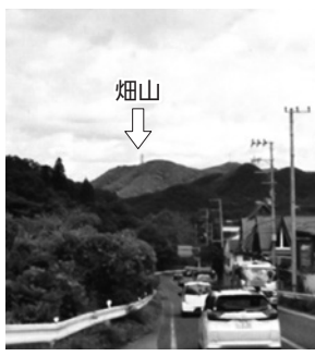
船坂(右に畑山、丸山は見えません)

上山口地区では畑山をバックに丸山が見られ、すみれ台地区からの眺望は左に丸山、右に畑山の峰が見えます。なお、畑山山頂には通信用アンテナがあり、識別できます。