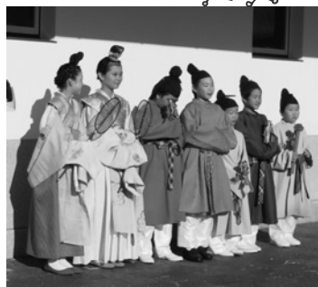
古代衣装の子どもたち