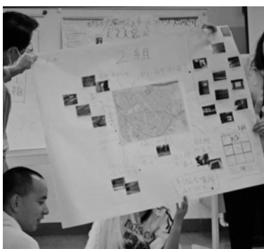
北六甲台小学校地区ハザードマップ

移動目的場所は北六甲台小学校校区内の平尻公園周辺、新天上橋周辺、有馬病院周辺の3カ所です。危険と思われるブロック塀、消火栓、自動販売機、防火水槽、鉄塔、階段の損傷、避難場所、側溝、用水路などの写真撮影をし、ハザードマップを完成させました。