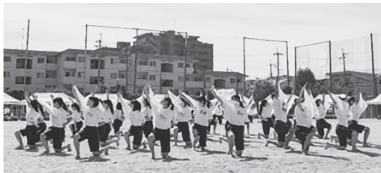
3年女子ダンス「未来」

体育委員長の「完全燃焼！仲間とともに熱くなれ！」という力強い宣誓。 競争競技や学年種目では白熱した戦いが繰り広げられ、観客席からは大きな声援が送られました。