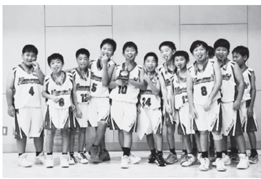
優勝した5年生チーム

男子ミニバスケットボールクラブは現在、男子41人が在籍しています。週に3回（日曜・火曜・金曜）、浜脇小学校体育館で練習しています。昨年、創部20周年を迎えました。チームスローガンの「Fight it out!」は、「闘い抜こう!」という意味があり、卒業生やBLEAGUE秋田ノーザンハピネッツ所属の土屋アリストア時生選手のお母さんが考えました。