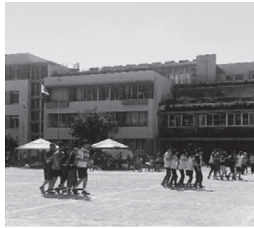
5人1組でムカデ競争

14町2団体（浜脇地区社会福祉協議会、浜脇地区青少年愛護協議会）の総勢600人が参加しました。 ムカデ競争、ボウリング、力くらべ、800mリレーなど、老若男女みんな楽しんでながら、力を合わせて頑張りました。