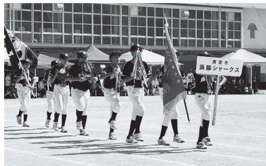
クラブチーム紹介の行進

閉会式では、60回記念のお楽しみ抽選会がありました。今回も、大盛況の地区運動会でした。 次回も、たくさんの方々が参加し、たくさんの方が盛り上がることを期待しています。