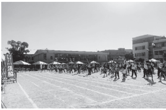
開会式後、全員でラジオ体操