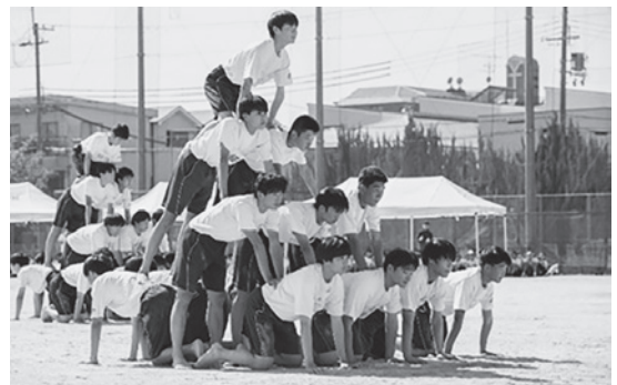
3年男子徒手体操「煌(きら)めき」

この日のために、学年一丸となって練習に励んできたダンスや徒手体操。一生懸命に演技する姿にたくさんの拍手が送られ、会場に大きな感動を与えていました。 生徒からは、「一部できなかった競技があったけど、無事に体育大会を行うことができて良かった」「練習の成果が出せて良かった」という声が聞かれました。