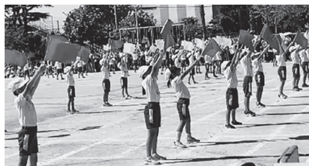
届け!! 3年生のアンテナ!!