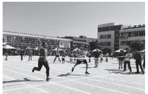
800mリレーは100分の5秒差の接戦