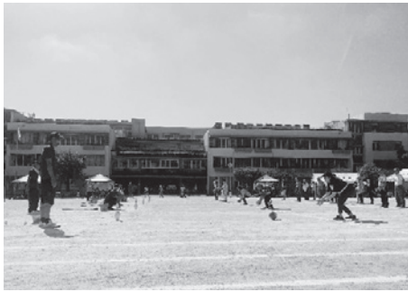
ボーリングビンめがけてコロコロ〜