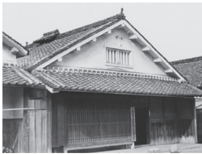
西宮市生瀬出張所(現在は生瀬市民館内の生瀬分室に変わっています)

明治22年4月の町村制の施行により、生瀬村と名塩村は合併して有馬郡塩瀬村(名塩の塩と、生瀬の瀬の合成)となりました。