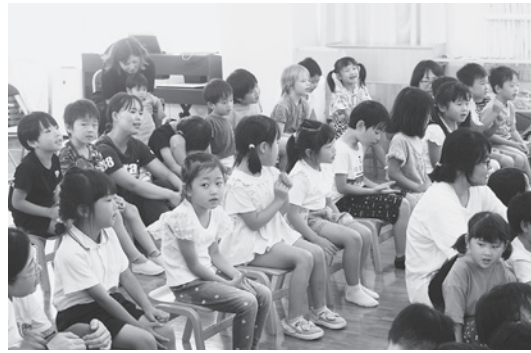
機会があるごとに、違う園の園児が集まって交流!

園児たちにとって、演奏を聞くのももちろん、楽器を見るのも初めてです。メンバーから楽器の紹介があり、それぞれの音色の違いなどの説明を受けました。