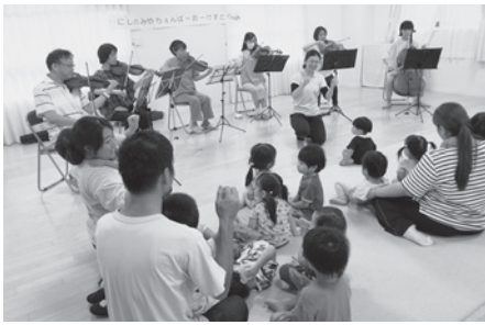
楽器の大きさ、音色などを比較し、楽器の名前を教えてくださいました

最初に、モーツァルトの『アイネ・クライネ・ナハトムジーク』が演奏されましたが、園児たちは、少し難しかったかも知れませんが、続いて、『となりのトトロ』やディズニーの曲が演奏されると、園児は手をたたいたり、体でリズムを取ったりしていました。