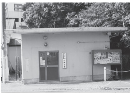
さようなら、生瀬交番！ 見守りをありがとうございました

交番廃止に伴い、今後は地域における犯罪防止に向けて、一層の啓発活動が求められると見られます。(防犯生瀬支部)