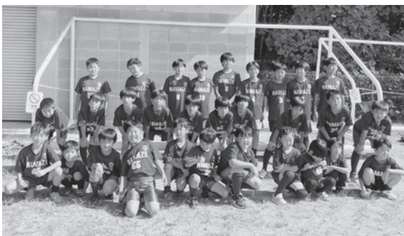
自信に満ちた顔の部員たち

ッカー協会4種に加盟し、協会主催大会に出場。これまでに全国大会、県大会、阪神大会など数多く出場しています。また、スポーツクラブ21が主催の大会にも参加して優勝しました。