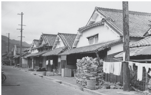
当時の生瀬の町並み(妻入り町屋造りの家が立ち並んでいた)

その後、昭和の大合併により、昭和26(1951)年に塩瀬村は西宮市と合併し、その結果、塩瀬村はなくなりました。塩瀬支所は名塩に置かれ、生瀬には出張所が置かれました。