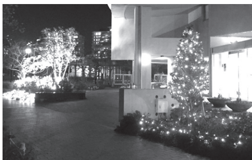
花のまちのバス道沿いを彩る電飾