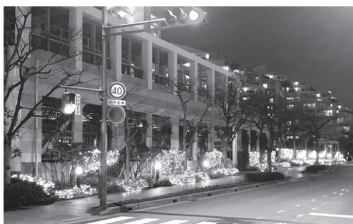
杜のまちのバス停から交差点まで延びた電飾

冬の西宮浜を彩るイルミネーションの季節が来ました。今年も、海のまちでは毎年恒例になっている「ひかりのツリー点灯式」が11月30日に開催されます。それに合わせて、海のまちではバス通り沿いをはじめ、各所で点灯します。杜のまちでは交番前その他、最近ではバス道沿いも点灯され、昨年はマリナパーク西バス停からさらに交差点まで延長しました。港のまちでは、北側の電飾とバス道沿いの植栽にLEDが輝いています。花のまちでは玄関前に電飾が点灯し、バス道沿いを華やかに演出しています。西宮マリナパークシティは