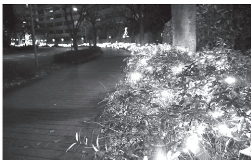
海のまちのバス道沿いを彩る電飾

冬の西宮浜を彩るイルミネーションの季節が来ました。今年も、海のまちでは毎年恒例になっている「ひかりのツリー点灯式」が11月30日に開催されます。それに合わせて、海のまちではバス通り沿いをはじめ、各所で点灯します。杜のまちでは交番前その他、最近ではバス道沿いも点灯され、昨年はマリナパーク西バス停からさらに交差点まで延長しました。港のまちでは、北側の電飾とバス道沿いの植栽にLEDが輝いています。花のまちでは玄関前に電飾が点灯し、バス道沿いを華やかに演出しています。西宮マリナパークシティは