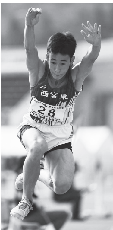
U16 ジュニアオリンピックカップ (2023)