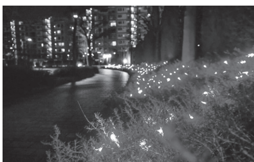
港のまちのバス道沿いを彩る電飾

阪神・淡路大震災の3年後、平成10(1998)年3月に街びらきし、海のまちでは募金を募り、セコイヤの木に希望の電飾が灯され、1000人でカウントダウンして「ひかりのツリー」が始まりました。他のまちにもその思いが繋がっています。ウオーキング、ランニング、犬の散歩、買い物など、マリナパークシティ内を移動する際、イルミネーションを見ながら、冬の寒い時期にこそ、ほっこり温まるひと時をお楽しみください。そして、イルミネーションで住みよい街をさらに演出し、資産価値の向上につながる良いですね。