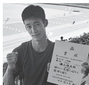
(インターハイ後の)県高校ユース陸上では、15m16cmで大会新記録