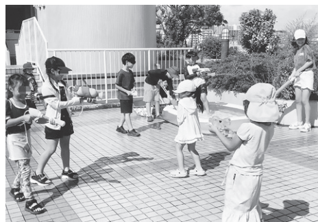
ぬれるのも楽しい水鉄砲

ピエント西宮住宅管理組合理事長の協力もあり、子ども会と共催で、初めて屋上庭園で夕涼み会を開催しました。総勢約60人が参加。水鉄砲、