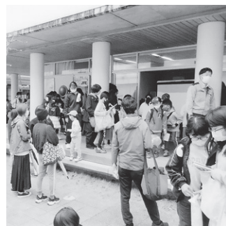
小学校はにぎやかでした (昨年の様子)