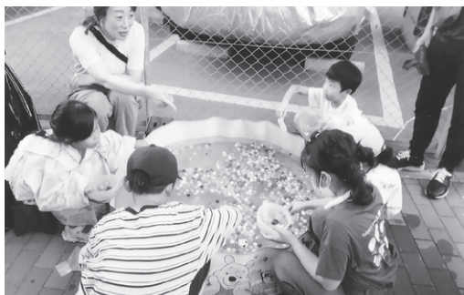
スーパーストボールすくいは人気です

スイカ割り、スーパーストボールすくいと、子どもたちは水にぬれながらも大はしゃぎで楽しみました。天気にも恵まれ、大人も子どもも夏の終わりを堪能しました。