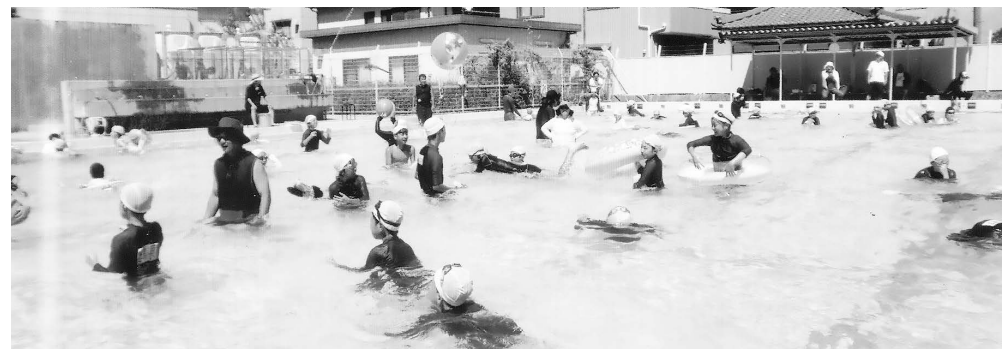
楽しそうに泳いでいます

り約25%も参加者が増え、プールでは水しぶきが跳ね、歓声が上がっていました。猛暑の中、見守りをしたスポーツクラブの多くの指導者、保護者、地区委員の皆さん、運営に協力いただいた人々に感謝を申し上げます。(スポーツクラブ21用海 不破)