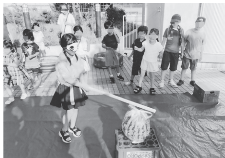
なかなか割れないスイカ

スイカ割り、スーパーストボールすくいと、子どもたちは水にぬれながらも大はしゃぎで楽しみました。天気にも恵まれ、大人も子どもも夏の終わりを堪能しました。