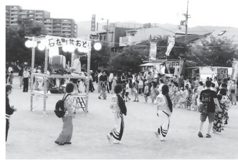
浴衣姿が夏ですね

5年ぶりの開催です。お金や労力をかけずに、いかにみんなが楽しめる盆踊りにするか。その課題に向かってやっ