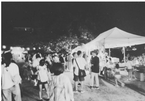
8月24日 下山口地区 盆踊り