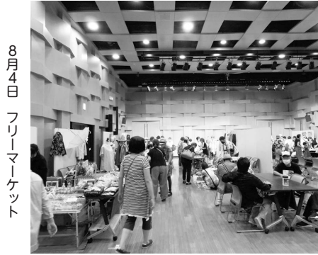
8月4日 フリーマーケット