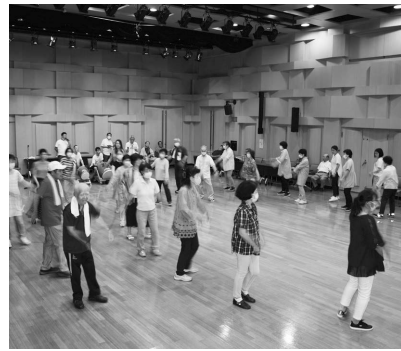
7月21・27日 袖下踊り伝習会