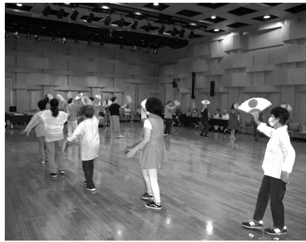
7月21・27日 扇踊り伝習会