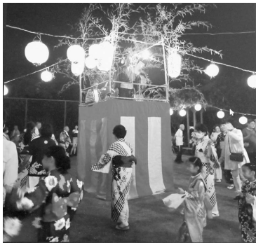
8月17日 中野地区 盆踊り大会