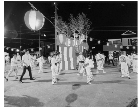
8月14日 上山口地区 盆踊り大会