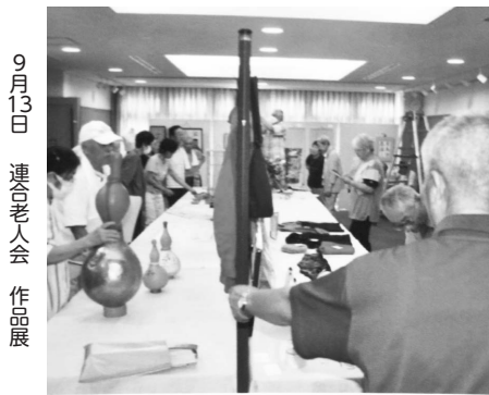
9月13日 連合老人会 作品展