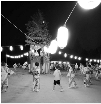
8月10日 名来地区 盆踊り大会