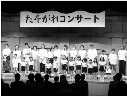
8月3日 たそがれコンサート