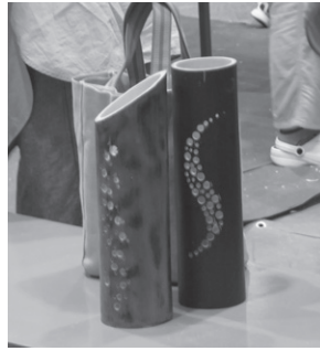
出来上がった竹灯りの作品です。

ザイン通りに穴を開けていき、完成後は、第3展示場でだんじりの前に作品を置き、LEDランプを入れて仕上がりを楽しみました。