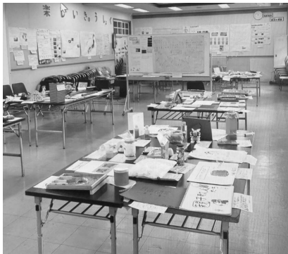
9月3日 北六甲台小学校 校内作品展