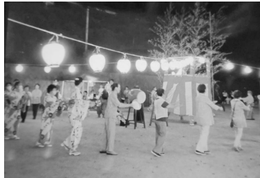
8月15日 船坂地区 盆踊り大会