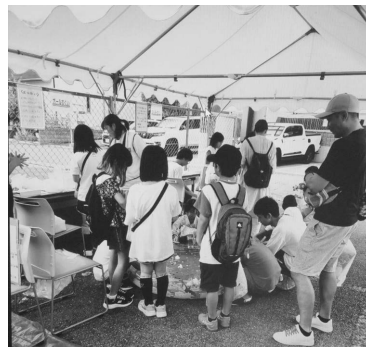
8月24日 上山口東地区 夏祭り