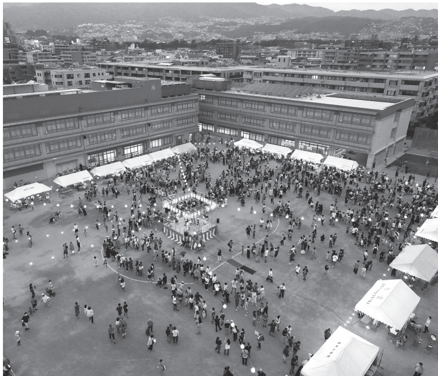
上空から見た会場

安井小学校舎改築工事のため、夏まつりは5年ぶりの開催になりました。校庭のレイアウト変更やスタッフの入れ替わりなど、心配なことはたくさんありましたが、2日間とも大盛況。アトラクションも盛りだくさんで、来場者は、久しぶりの祭りを楽しんでいました。 (来場者数 2日間で約6000人)