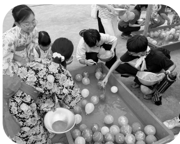
ヨーヨー、たくさん釣ったね