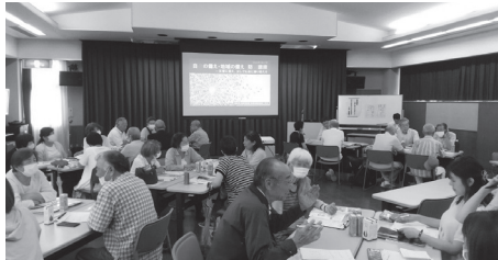
防災について話し合う参加者

です。昨年、安井小学校で地域の人たちが参加した防災発表会の事例も紹介されました。市が発行し、各家庭に配布されている防災マップ(ハザードマップ)についても説明がありました。マップには、市内全域の洪水・土砂災害、高潮や津波が起きたときの危険区域や避難所の情報などが載っています。参加者からは「自分の住む地域とその周辺の情報をまとめた物があれば、より分かりやすいのでは」という意見もありました。