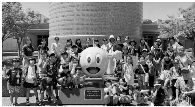
スキッパーの像を囲んで記念撮影

バスに乗って大阪ガス科学館(高石市)へ。館内ではマスコットキャラクター・スキッパーの案内で『見つけよう! 環境とエネルギーのいまとつみらい』の映像を見ました。地球温暖化の原因や2050年を目標にしたカーボンニュートラル(※)の実現を目指した取り組み、省エネルギーのことなどを学習しました。