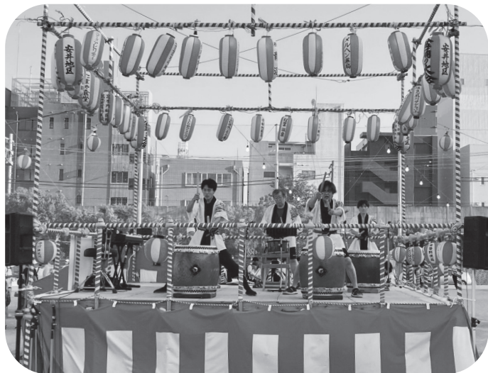
迫力ある和太鼓演奏