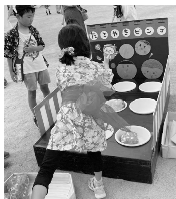
たこ焼きビンゴできたかな?