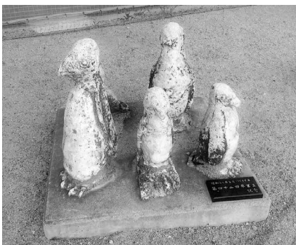
校庭に戻ってきたペンギン