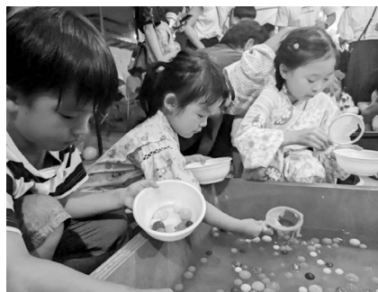
みんな大好きスーパーボール