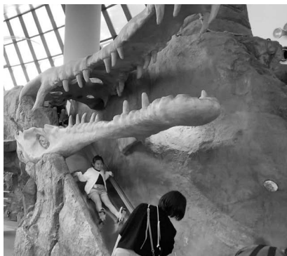
恐竜の体が滑り台に

午後からは堺市立ビッグバンに行きました。施設内では、高さ約53mもある巨大ジャングジムを登ったり、恐竜の体の中やツリーハウスで遊んだり、昭和の街並みを歩いたりして思いきり楽しみました。