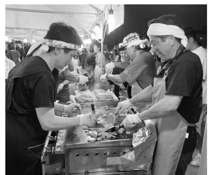
祭りといえば「焼きそば」!