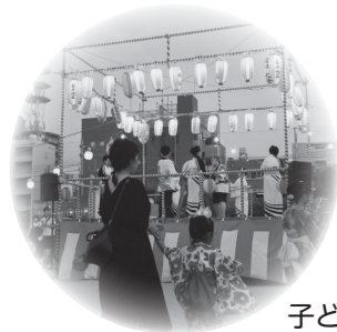
子どもと一緒に踊ったよ