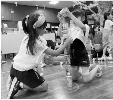
チーム対抗で行われた缶積みゲームでは、接戦が続きました

☆安井市民館では 8/28 市民館の各部屋でポッチャ、おもちゃ釣り、パクンすごろく、お化け屋敷、防災ポンチョ作りなどがあり、館内を回って楽しんでいました。