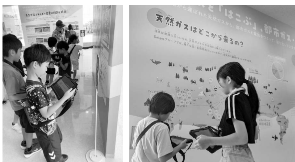
問題を解きながらエネルギーを理解

その後は、チームを作って大きなパネルの二次元コードをタブレットで読み取り、問題を解きました。最後に、未来の環境とエネルギーのために「使わない電気を消す」「ごみの量を減らす」「食品のロスをなくす」など、自分たちができることを考えて約束しました。