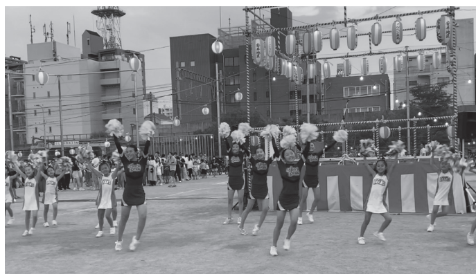
キレイのある演技に拍手👏