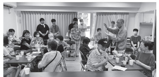
懐かしい昭和歌謡を歌う参加者

集会室(分銅町住宅側)では、コーヒーを飲みながら和やかに談笑したり、歌謡曲の動画を見て、『銀座カンカン娘』や『青い山脈』、『月がとっても青いから』などを合唱したり…。暑い日でしたが、涼しい室内で楽しいおしゃべり会になりました。