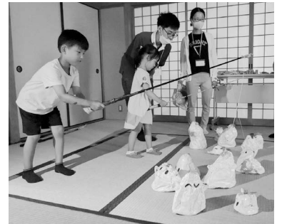
お化けを釣ると中にはお菓子が

☆安井市民館では 8/28 市民館の各部屋でポッチャ、おもちゃ釣り、パクンすごろく、お化け屋敷、防災ポンチョ作りなどがあり、館内を回って楽しんでいました。