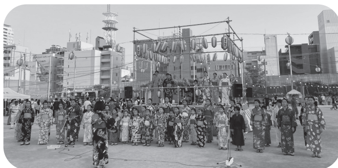
浴衣姿での美しい歌声に、暑さも忘れまして