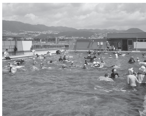
カラフルな浮き輪なども持ち込みOK