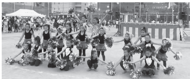
ハイ、ポーズ。決まったね!