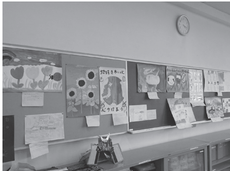
旅行先の絵やポスター、かぶとや刀も