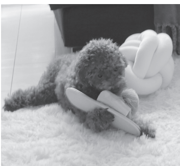
スリッパと格闘中

人が大好き過ぎて、特に若いお姉さんが大好きです(笑)。その半面、顔見知りのワンちゃんたちに寄ってこられると怖がってしまいます。でも自分から寄っていくのは大丈夫らしいです。