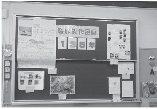
1年生、3年生、5年生の作品展示