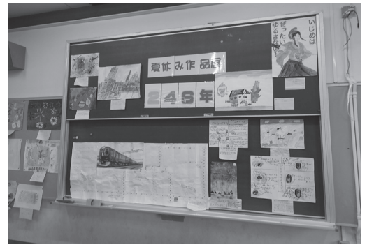
2年生、4年生、6年生の作品展示