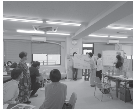
グループ発表風景

柳本町にある地域活動支援センター「うらら」で、7月18日に平木地区社協のボランテイヤ研修会が行われました。対人援助を行う上で大切なことは「相手の話をしっかりと聞く、相手の感情や悩みを理解する、相手を受け止める」など、大切なことを学びました。