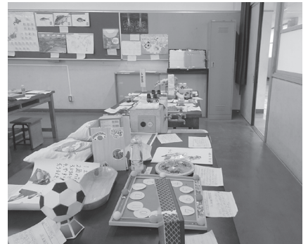
サッカーボールが目立っています