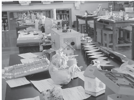
パステルカラーの作品が多く並んでいます