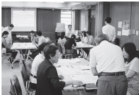
災害に備えて図上(イメージ)による訓練

地震に対する対策として、家具の固定、防災耐震ユニットを設置し、防災持出バッグを備える。次に、避難に対する対策として、近くの避難場所を認識しておく、避難所までのルート確認と確保。トイレ・テントの設置なども考えておきます。