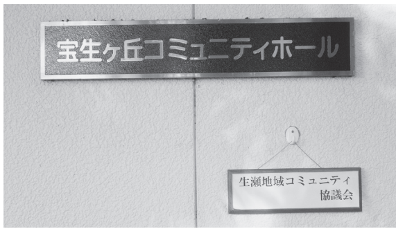
小さな表札ですが、大きくはばたきます