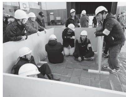
避難所開設訓練(居住スペースのレイアウト)