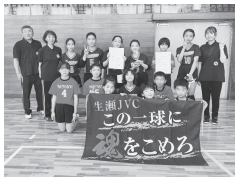
全員一丸となって試合に臨むことができるチーム

時と木曜日16時半〜18時半に活動しています。瞬発力を養うためのトレーニング、ボールコントロールの基礎練習を大切にし、各自目標に向かって頑張っています。時々卒業生が来て、練習の手伝いやアドバイスをし、試合の審判も手伝います。