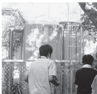
24tの水道水を常時ためている受水槽

阪神・淡路大震災で建物強度が低下しており、東南海沖地震や首都直下地震の連鎖から生き残る体制づくりができることを目指します。