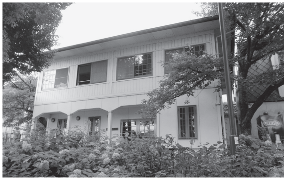
事務所は、この建物の2階です