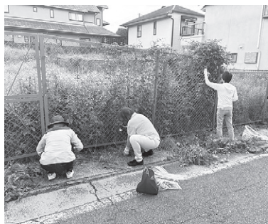
細いところまできれいにします

いた場所を皆さんで協力し合い、一掃できる良い行事ですね。子どもからは「道路がきれいになって良かった」との感想がありました。また「溝のごみを一緒に拾おうね」とほほ笑ましい家族のひとコマも見られました。 清掃の後、自治会から飲み物が配られ、「ひと仕事の後はおいしい」と、満足げに飲み干していました。