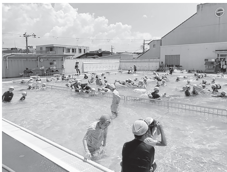
青い空の下、思いっきり泳ぎます

今年もたくさんさんのボランティアに支えられ、無事に開催されました。皆さんに感想を聞きました。