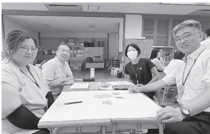
ワイワイと意見交換できました