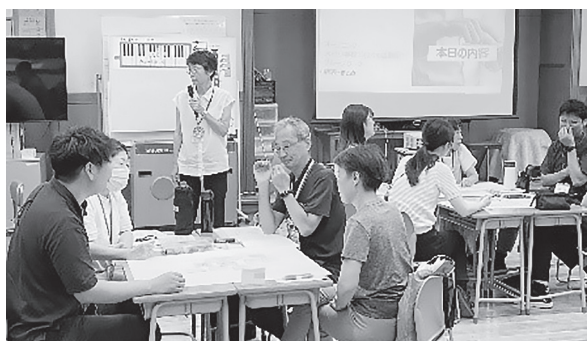
地域・教職員・保護者が参加

コミュニティ・スクールは学校、地域、保護者が一体となり「地域とともにある学校づくり」を目指す取り組みです。