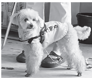
マンツーマンでトレーニング

は、施設によって犬種が異なり、みみの里ではトイプードルがその役割を担います。また、みみの里では（他施設では異なる場合あり）訓練士が育成するのではなく、聴導犬と生活したい障がい者自身がトレーニングをします。