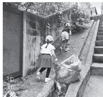
思いの他、草が茂っています

清水・満池谷自治会も6月2日、大人85人、子ども15人が参加して、町内の道端で雑草引きやごみ拾いなどの清掃活動に励みました。 日曜日と重なり、家族そろっての参加も多く、大人からは「雑草など普段気になって