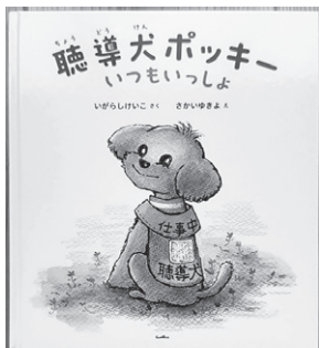
聴導犬についてよく分かる絵本もあります

は、施設によって犬種が異なり、みみの里ではトイプードルがその役割を担います。また、みみの里では（他施設では異なる場合あり）訓練士が育成するのではなく、聴導犬と生活したい障がい者自身がトレーニングをします。