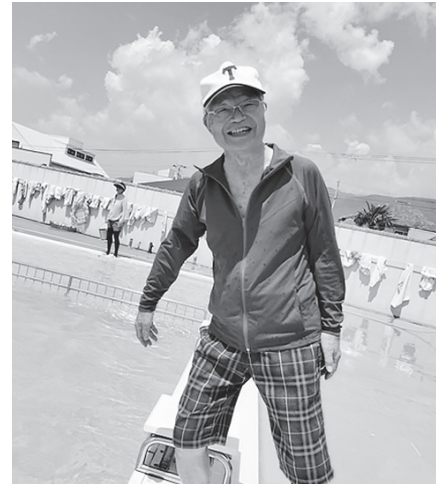
長い間、ありがとうございました