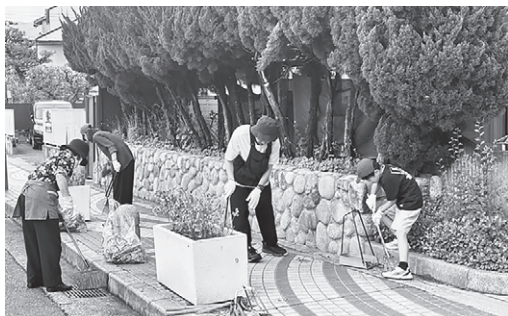
通学路もきれいにします

西宮市では、地域の団体や学校、事業所などと協力して、市内の道路や公園など、公共の場所を清掃する美化活動「わがまちクリーン大作戦」を年に2回（6月・12月）実施しています。