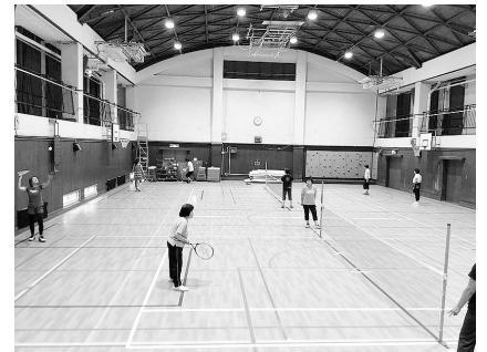
初心者も経験者も楽しめる白熱の試合

ジしやすいのがクォーターテニスの良い点だと語ります。「クォーターテニスはバドミントンと同じコートを使用するので、一般的なテニスよりも守備範囲が狭いですし、見えやすい黄色の大きなスポンジのボールを使います。バドミントンのシャトルと比べるとボールのスピードは緩やかなので、運動が苦手な人や初めての人、高齢の方も、参加した初日から楽しめます」(齊藤さん)