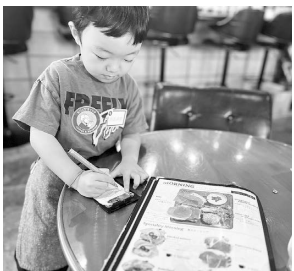
▶注文を書き留めます ニュースキャスター体験▼

主催は商店会「苦楽園ストアーズミートイング」で、「夏休みを利用して子どもたちに職業体験をしよう」「お店と地域の人たちがつながる」をテーマに昨年から始めたイベントです。職種は飲食店、カフェ、保育園、ニュースキャスター、アパレル、旅行会社、バレエスタジオ、美容室、バーなど多岐にわたります。