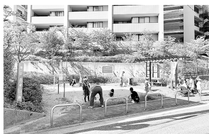
▲雑草をみんなで手分けして抜いていきます!

13団は西宮市と公園清掃等管理協定を結んでいて、樋之池東公園と毘沙門公園で月2回清掃活動を行っています。ごみを拾って雑草を抜くと、あつという間に袋いっぱい。いつも使っている公園をみんなできれいにすると気分爽快です。夏休みはお楽しみとして花火大会や、金魚すくいのポイを的として頭に付け、水鉄砲で狙い合うサバイバルゲーム大会を開催！ 大人から子どもまで楽しく活動しました。