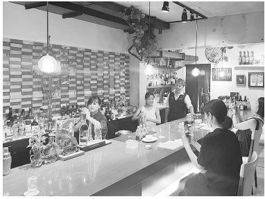
シェイカーを振る姿がカッコいい!

昨年は1週間で延べ250人が参加したそうです。参加倍率が高くなってしまったため、今年は期間を2週間に延長し、延べ550人の募集としました。