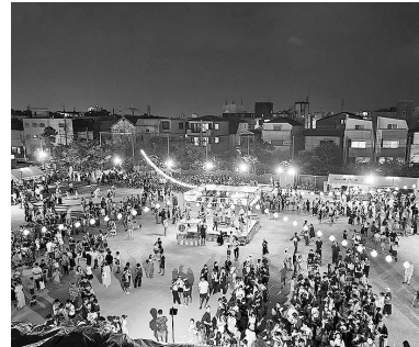
にぎわう会場の様子

暑さが厳しい中、8月2日、4日にかけて、北夙川小学校で5年ぶりにサマーフェスティバル・イン越木岩を開催しました! 過去最多の地域の皆さんが来場し、大盛況で幕を閉じました。