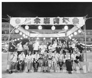
私たちが越木岩青年会です!

サマーフェスティバルは50年にわたって続く伝統的な地域行事で、青年会だけでつくり上げてきたものではありません。共催の越木岩自治会や地域各団体の皆さん、北夙川小学校をはじめとする学校関係者の皆さん、協賛企業やクラウドファンディングでご支援いただいた皆さん、そして何より地域の皆さんのご協力があったからこそ実現しました。改めて、多大なご支援に感謝申し上げます。