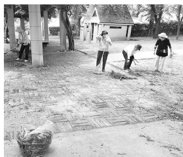
みんなで公園をきれいにしましょう

越木岩会館北側を10分ほど行くと、坂の上に豊楽公園があります。私たちは月に1度ペタンクをして楽しみます。初めて参加する人もいて、友だちも増えました。