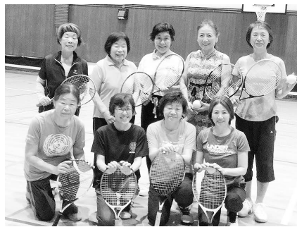
一緒にプレーを楽しむ会員を募集中

第8回目のスポーツクラブ21の活動紹介は、西宮発祥のスポーツとして知られるクォーターテニス。「年齢を重ねても無理なく続けられる運動を」と、昭和60(1985)年に西宮市教育委員会の職員が考案したのが始まりだそうです。