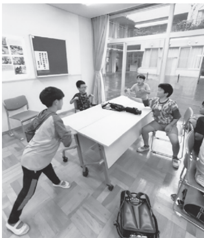
宿題の後の遊びは楽しい

宿題が終わると遊びの時間。教室の空気はさらに開放的になり、みんな伸び伸びと遊んでいました。ボードゲームや卓球、折り紙、自分たちでプログラミングをしたゲー