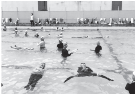
ペットボトルを持って浮く練習

が大切ということを学びました。また、溺れている人を見つけたときは飛び込んでいくのではなく、ペットボトルやランドセル、膨らませたビニールに少し水を入れた、身の回りの「浮力体」を溺れた人の方へ投げて浮いて待てる状況をつくるのが先決だという話に、子どもたちは真剣に耳を傾けていました。