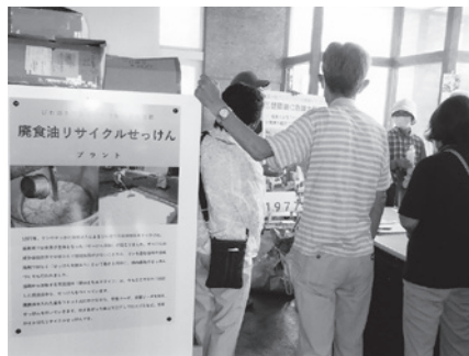
廃食油からせっけんへリサイクル

7年ぶりに開催された研修バスツアー。35人の参加者で、滋賀県東近江市の「あいとうエコプラザ菜の花館」へ環境学習に行きました。廃食油から作られるせっけんや、くん炭など循環サイクルを学びました。