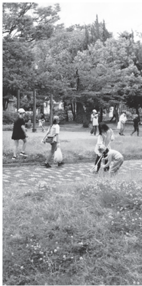
東三公園も美しく

年2回の「わがまちクリーン大作戦」。「西宮市内を美しく」をモットーに、今年も実施しました。普段の公園の草抜きや掃除以外に、自分たちの住む町を隅々までごみ拾いに回りました。 相変わらず、たばこの吸い殻と空き缶がありました。