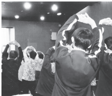
仲良くいきいき体操(5/27)