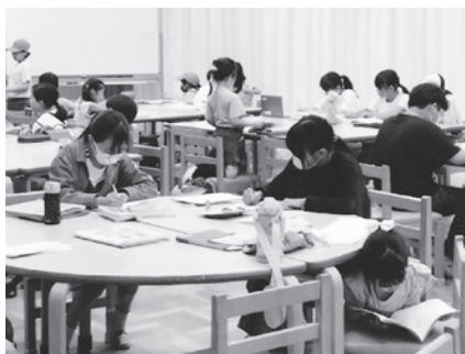
真剣に勉強しています

ムで、さらににぎやかになりました。給食の後、13時半から15時半までに宿題を終わらせ、友だちと遊んで楽しかったことでしょう。「数年後、トライやる・ウィークなど地域の行事で、成長した子どもたちに出会うのが楽しみです」と、ボランティアは温かく見守っていました。(辻)