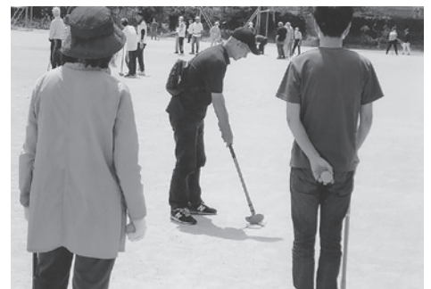
精神を集中しています