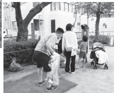
家族総出で参加(池田公園)