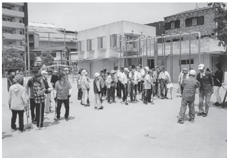
さあ頑張るぞ! と集まりました