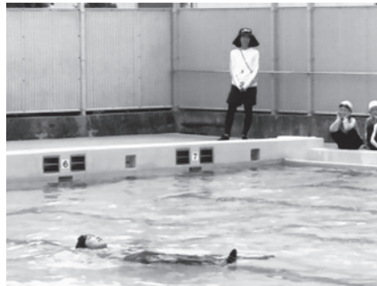
背浮きの手本を見て学習

では「溺れたときはどうするのかわかるか？」先生が背浮きする姿をまねて、それぞれ練習していました。持ってきたペットボトルを抱えて水に浮くものを身につけると体が浮きやすくなることを学び、溺れたときは「背浮きで待つ」こと