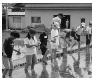
6月5日 山口小学校 5年生 田植え