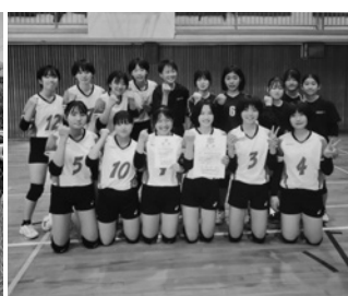
令和6年度 西宮市民体育大会 山口中学校 バレーボール準優勝