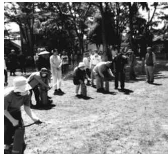
消火器の放水訓練

地震、水害が頻発しており、防災意識を高めることは命を守ることに繋がります。この名来地区も数十年前に有馬川が氾濫し、水害に襲われたことがありますが、ほとんどの人たちは記憶に残っていないようです。このため、市・