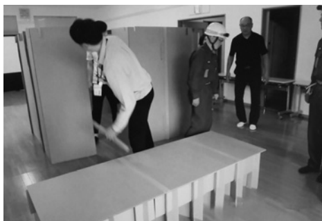
簡易段ボールベッドの作り方

雨模様の中、市・防炎危機管理課、北消防署山口分署と上山口分団の協力を得て、6月30日にすみれ台式番館で防災訓練が行われました。能登半島地震の影響で、防災用品と簡易段ボールベッドは、参加者の興味を集めていました。