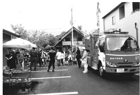
すみれ台 防災訓練

雨模様の中、市・防炎危機管理課、北消防署山口分署と上山口分団の協力を得て、6月30日にすみれ台式番館で防災訓練が行われました。能登半島地震の影響で、防災用品と簡易段ボールベッドは、参加者の興味を集めていました。