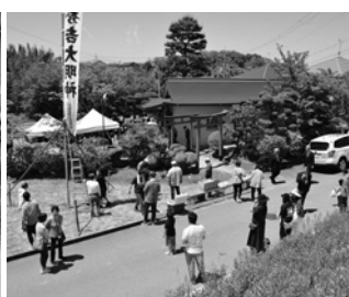
5月5日 城垣内稲荷神社 大祭