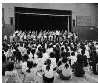
6月28日 北六甲台小学校 校内発表会(合同音楽会)