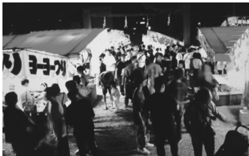
7月7日 公智神社 夜の境内

した。親に付き添われて浴衣を着たかわいい子どもたちは、夜店の香ばしいご焼きやベビーカステラなどの匂いにつ