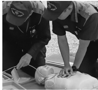
AEDの使用について実演