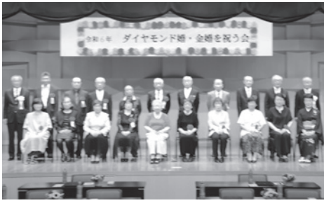
ダイヤモンド婚、金婚式を迎えた皆さん