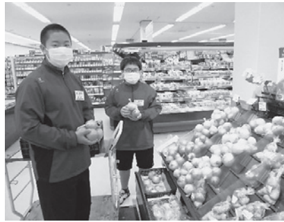
コープこうべマリナパーク

神戸地方検察庁に行った生徒からは「本物の裁判を傍聴し、本物の手錠を触ったりして、とても貴重な体験をすることができました」。裏千家茶道教室での体験を終えた生徒たちからは「茶道の先生のお茶の作法を教わって、実際