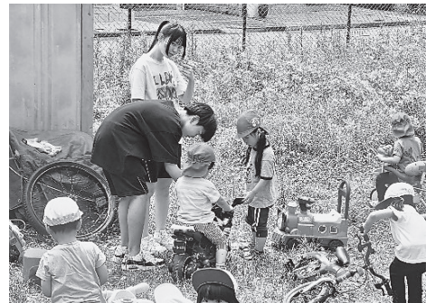
子育てサポートひびぼ