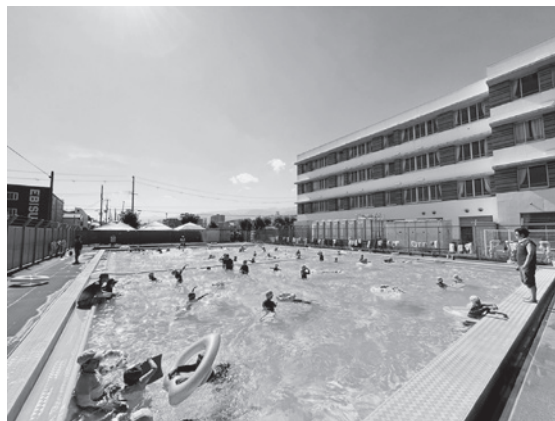
快晴！ 猛暑！ プール日和！