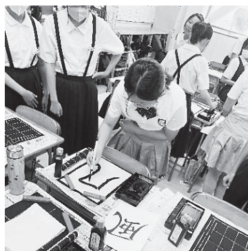
声を掛け合い、字を仕上げます

書道の授業ではグループに分かれ、一つの漢字を一角ずつ順番に書く書道リレーを行いました。