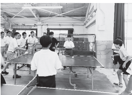
日本vs中国 大盛り上がりでした！

体育の授業では卓球、バドミントン、バスケットボールのフリースローの3種目を日本対中国で対戦しました。