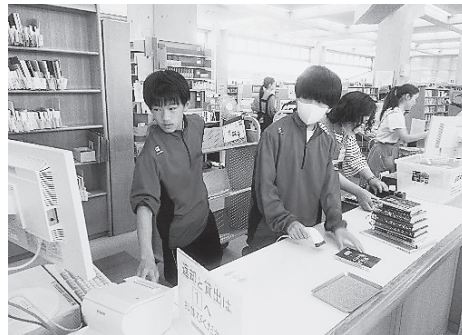
西宮市立中央図書館

にお茶をたてたり、和菓子を作ったりして楽しかったです！」といった声が聞かれました。 * * 今回の活動を通し、生徒たちはたくさんのお話を学び、前向きに大きく成長することができたことでしょう。