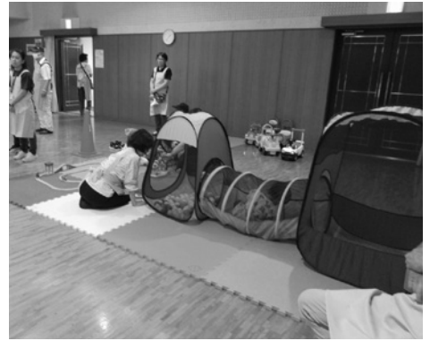
△ あいの家フェスタ ▽