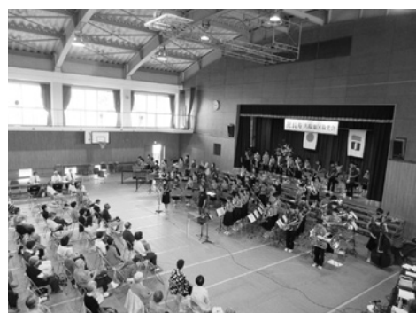
令和4年度名塩地区敬老会

東山台小学校PTAのOGによる女声コーラスグループ「ヴァンヴェール」の合唱やオカリナ五重奏のミニコンサートなど工夫をこらした楽しいプログラムのほか、福祉に関する相談窓口の紹介などが企画されている。 昨年同様、事前申し込みは不要で、誰でも参加できる。65歳以上の参加者には福祉作業所の手作りお菓子などの土産が用意されており、多数の参加が呼びかけられている。 〈名塩地区敬老会〉 尚歯会として長い伝統を持つ名塩地区は、名塩小学校体育館で9月29日(日曜日)、午後1時半受け付け、2時開式の予定。