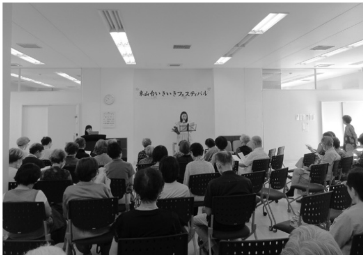
令和5年度東山台いきいきフェスティバル

9月敬老月間を迎え、区域の高齢者の長寿を祝う敬老のつどいが、東山台、名塩両地区において、各地区社協の主催で開催する運びとなった。 〈東山台いきいきフェス〉 東山台いきいきフェスティバルは、敬老の日の9月16日月曜日、午前10時30分から斜行エレベーター2階のナシオンホールで開催される。