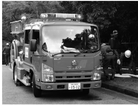
中継の上甲子園分団ポンプ車

6月18日、宝塚砕石株式会社の場合内において、西宮市の土砂災害関係機関合同訓練が行われた。参加したのは、市危機管理室、市消防局、陸上自衛隊第三師団第36普通科連隊、兵庫県警西宮警察署・甲子園警察署、災害時応援協定団体の西宮建設協会、株式会