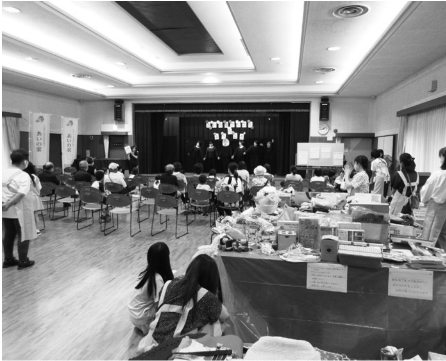
△ 舞台では劇団スコップの劇