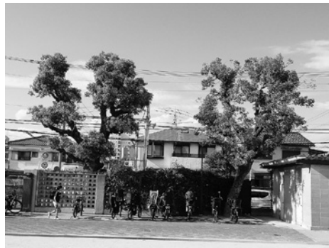
● クスノキ (アサヒビル寄贈)