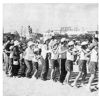
みんなで踊ろうジェンカを