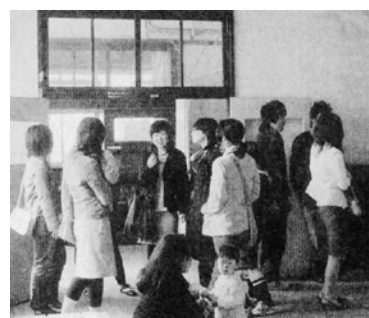
思い出を話し合う卒業生

津門小学校校舎改築工事に伴い、運動場に仮設校舎が建てられるため、「体育会」と「津門地区ファミリー運動会」が合同で津門中学校グラウンドを借りて、津門ふれあい体育会として10月8日に実施されました。合同検討委員会を何度も開き、会場準備、用具の運搬、演技種目、進行、練習の日程、児童の安全な移動、雨天時の日程など、円滑な運営ができるよう準備をしました。