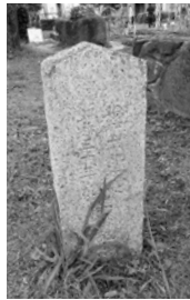
● 百葉箱 この東側にはビオトープがあります。