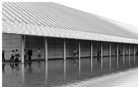
水の上を歩いているように見えます。歩く先に美術館の入り口があります

その後、「琵琶湖マリOTTホテル」に移動し、併設のプラネタリウム「デジタルスタードームほたる」で、「アースシンフォニー〜光と水が奏でる空の物語〜」を鑑賞しました。スクリーンに映し出された満点の星空やオーロラ、流星群、雪や雲、地球を包む大気が起こす美しい現象を、圧倒的なスケールで表すダイナミックな音楽と色彩豊かな映像を体感しました。