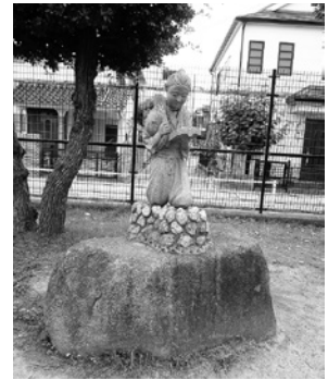
● 震災で足が折れた二宮尊徳(金次郎)像