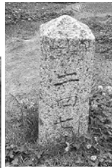
● 謎の標柱2つ 右、水準標2479の文字 左、昭和29年・30年度卒業記念と書かれています。