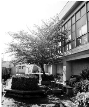
● サクラ 平成元年、講堂の南側にソメイヨシノが10余本植えられました。