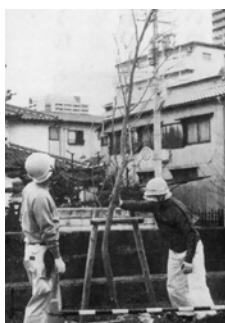
補植されるサクラの若木

津門地域の中心を流れる津門川。すべての橋に銘板が取り付けられ、3月下旬にはサクラとヤナギの木が植樹されました。