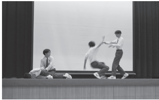
西宮海上保安署での体験を寸劇で発表

日は保護者、校長、教頭、教員、地域の人たち、生徒一同が見守る中、5月13〜17日に地域の各事業所などで行われた「トライやる・ウィーク」の体験について、グループごとに発表しました。