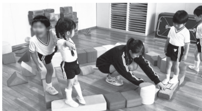
ソフトブロックでもお姉さん先生と楽しく！

幼稚園側としては、「園児たちの世話だけでは物足りないのでは？」とも思っています。