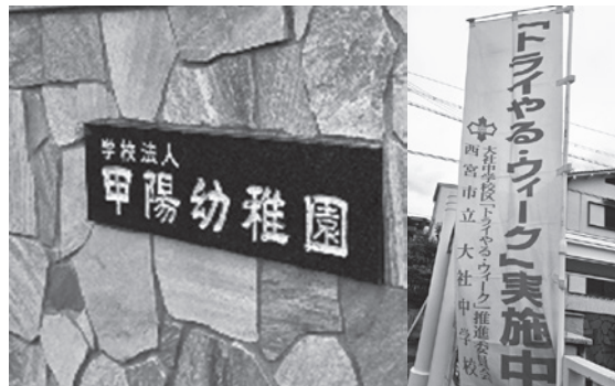
大社中学校2年生が実習した幼稚園