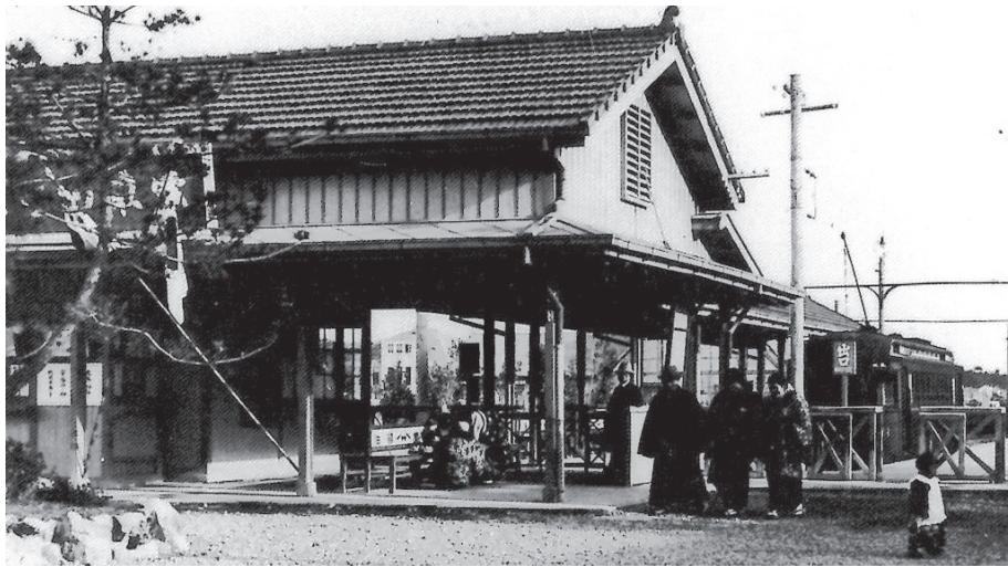
開通の日か国旗が見えます。 電車ポール型39号1両編成