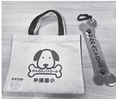
甲陽園小学校ホームページ内「コミスクボランティア募集」よりweb登録できます

犬の散歩の時、見守りグッズ(左写真)を身に付けて、子どもたちや地域の安心安全を見守るボランティアをしませんか!