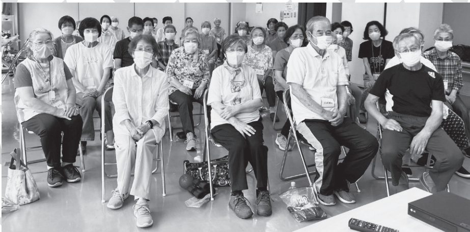
上甲子園地区社会福祉協議会主催の「西宮いきいき体操」に参加の皆さん (甲子園口市民館) 令和6年6月撮影

「アクティブシニア」とは ・ 仕事や趣味に積極的 ・ 健康意識が高い ・ 新しい価値観を柔軟に受け入れる など、年齢を重ねてもいきいきと活動したいと、意欲的に取り組む活発な高齢者の通称です。