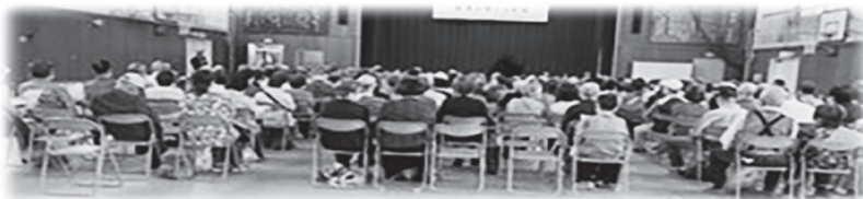
令和5年度の長寿を祝うつどい

70歳以上の人には お祝いにタオルを配布 (昭和29年12月31日までに 生まれた人)