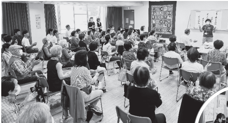
天寿会 上甲子園公民館 参加者と一緒に、西宮いきいき体操を体験。