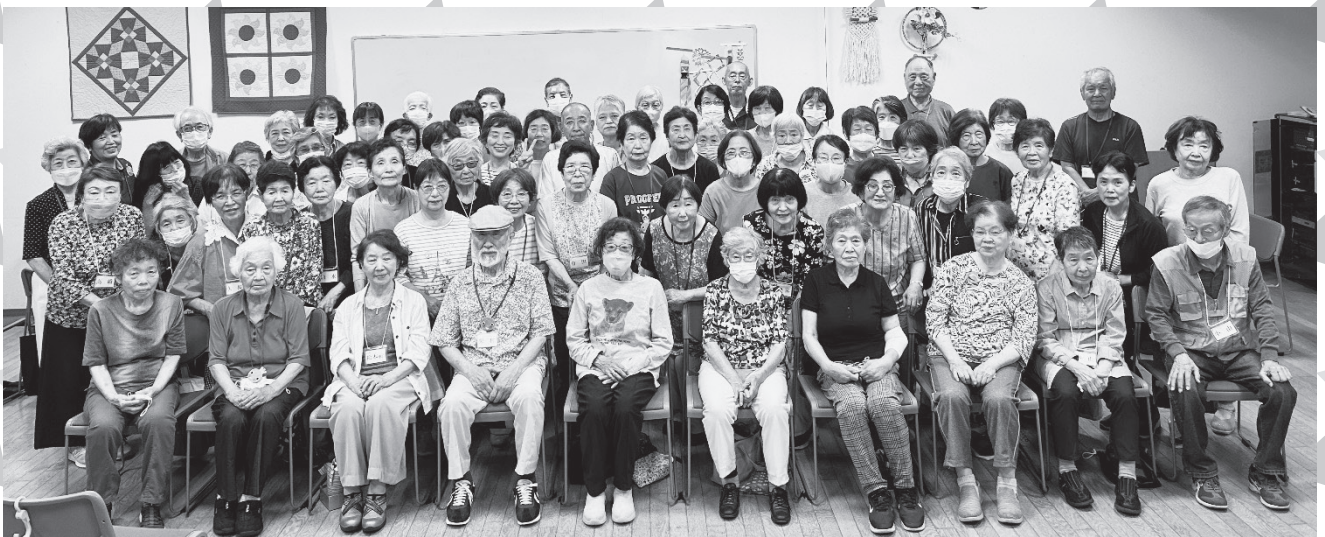
天寿会上甲子園校区主催の「西宮いきいき体操」に参加の皆さん(上甲子園公民館) 令和6年6月撮影

そのうち70歳以上の人口が約20%です。アクティブシニアの皆さんの活躍が地域に絆と活力を与えています。 体調に留意して、楽しく活動を続けてくださいね。