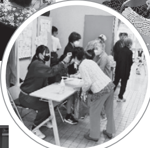
受付で検温の手伝い