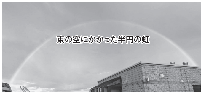
東の空にかかった半円の虹