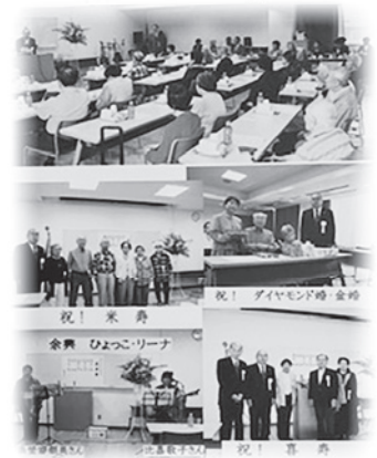
平成29年度の祝福会

対象：令和6年にダイヤモンド婚・金婚を迎える夫婦会員 白寿・米寿・喜寿を迎える会員