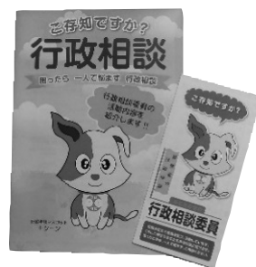
行政相談委員のパンフレット

をしています。行政相談委員は、法律に基づいて総務大臣から委嘱され、皆さんの身近な行政相談窓口になるのが役目です。現在、西宮市には8人の行政相談員があり、市役所で毎月2回の相談会を開催しています。