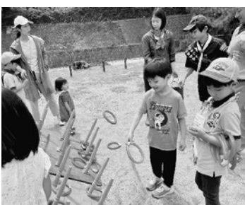
来年も開催予定！ お楽しみに！

収益の一部は、西宮市「青い鳥」福祉基金と日本赤十字社能登半島地震災害義援金に寄付しました。たくさんの方の来場ありがとうございました。