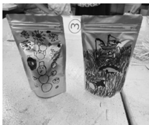
冷却パックの完成品

その後、図工室で自由に絵を描き、オリジナルの冷却パックを作りました。最後は一斉にアルミパックをたたき、パックは一瞬で冷たくなりました。