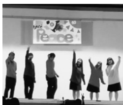
オープニングの様子

西宮甲山高校は「第40回甲山フェスティバル」を6月13、14日に開催しました。オープニングは生徒会の動画。各クラブや学年団の先生のパフォーマンス動画でにぎやかに幕を開け、それぞれの個性が光