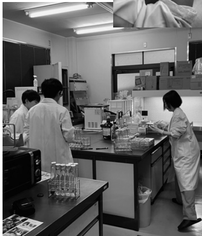
白衣姿も新鮮。本格的な器具を備えたラボにて