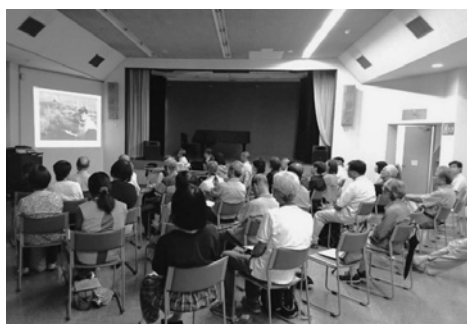
越木岩公民館地域学習推進員会講座風景

見るからに、語るほどに真面目さが伝わってくる生方さん。これからも地域に根ざした活動をお願いします。