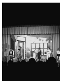
3年生の舞台『トイ・ストーリー』

1年生は展示、2年生はアミューズメントと模擬店、3年生は劇で、一生懸命盛り上げていました。特に、北高伝統のクラス演劇が行われた体育館は、観劇する保護者、関係者の熱気で包まれていました。