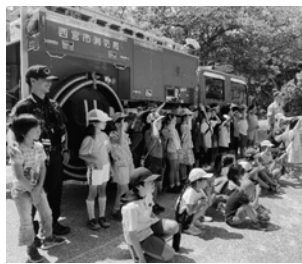
消防士さん、ありがとう

例年よりも暑い6月15日、苦楽園地区青少年愛護協議会キッズのびのび事業で、西宮消防署北夙川分署の消防士から熱中症についての話を聞きました。クイズを交えながらの楽しい説明に、子どもたちは対策や対処法を学びました。