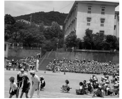
エキシビジョンリレー

学年ごとにプログラムが設定され、どの学年の児童たちも、リレーカーニバルに向けて一生懸命に練習を頑張ってきました。 来場者の人数制限がなくなり、グラウンドでは多くの保護者が観覧。たくさんの方の応援を送っていました。力を合わ