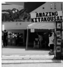
出迎えはスパイダーマン!?

西宮北高校は「北高祭」を6月14、15日に行いました。今年のテーマは「Ballon Monster」。若い発想力を風船のように大きく膨らませ、最高に、そしてモンスター級に北高祭を楽しもうということです。