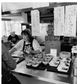
卒業生の校内食堂

りました。卒業生が中心となって運営する食堂は、地元の新鮮野菜をふんだんに使ったメニューで、心と体にエネルギーを補給。こちらも大いににぎわいました。