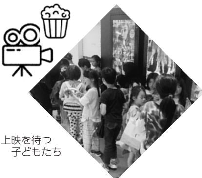
上映を待つ子どもたち

参加した子どもたちにはかわいらしいプレゼントが手渡され、思い出に残る交流の場となりました。今後もさまざまなイベントを開催し、盛り上げていきます。