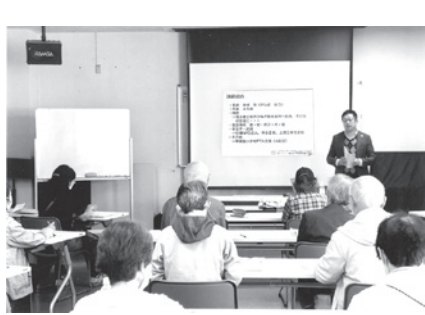
講演を熱心に聞く参加者

元不明になったときのために、1 自分の状況を書いておく住所、氏名、生年月日、血液型の他、保険証番号、持病