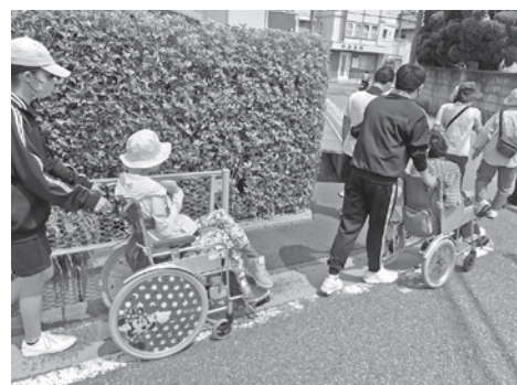
トライやる・ウィークで訪れた中学生と共に

毎月第1・第3月曜日に障がいのある人や高齢の人、子どもたちとみなんでおしゃべりを楽しみながら、ゆったり、まったり神原をぐる～っとお散歩しませんか。 ☆事前申し込み、参加費は原則不要です。開始時刻までに神原公民館にお越しください ☆雨天の場合は中止です 〈問い合わせ先〉 西宮市社会福祉協議会 共生のまちづくり課 ☎ 0798-61-1361