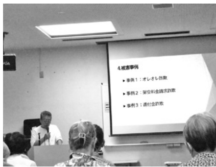
プロジェクターで分かりやすく説明

兵庫県では 1220件、約20億円 西宮警察管内では 120件、約3億円 (前年度より1億2千万円増)