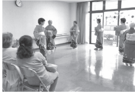
オープニングから盛り上がる!

みんなで一緒に! 踊りの輪 神原公民館で行われている神原地区社会福祉協議会主催の「ふれあいサロン☆いきいきかんばんら☆」は、地域の誰もが参加できる集いの場です。7月11日、神原幸友会民踊部のメンバーによる民踊があり、「神戸まつり音頭」など5曲が披露されました。