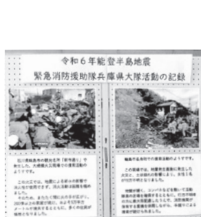
被害の様子が写真で伝わります

パネルで伝える支援活動 「緊急消防援助隊兵庫県大隊」による、能登半島地震の支援活動の様子を記録したパネル展が、7月5日まで神原公民館1階のロビーであります。 西宮市消防局からは、1月15日~2月21日まで、25隊100人が順次被災地に派遣され、消防・救助・救急活動が行われました。復旧作業では断水や道路の寸断、降雪などさまざまな困難がありました