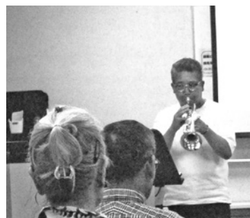
トランペット演奏で会場も和やかに

冷やし固めたものでした。マーガリンという名前はギリシャ語の「Margarite (真珠)」に由来しているそうです。やがてマーガリンは世界中で使われるようになり、日本にも明治中頃に入ってきて「人造バター」と呼ばれました。戦後の復興期を経て高度経済成長期になると、食生活が豊かになり、マーガリンの需要は大きく膨らみました。ソフトタイプ(植物性油脂使用)の登場もあって、おいしくて便利な食品として、日本中の食卓で親しまれています。