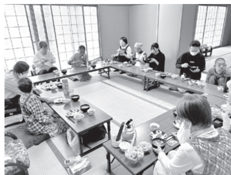
食事をしながら会話が弾む

その他には、「トライやる・ウィーク」で訪れた中学生に、青葉園生と地域の人たちが交流する様子を見てもらったり、神原公民館で開かれる西宮市民文化祭で活動紹介の展示をしたりして、年間を通して地域の中で充実した時間を過ごしています。