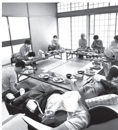
今日のメニューは何？

その他には、「トライやる・ウィーク」で訪れた中学生に、青葉園生と地域の人たちが交流する様子を見てもらったり、神原公民館で開かれる西宮市民文化祭で活動紹介の展示をしたりして、年間を通して地域の中で充実した時間を過ごしています。