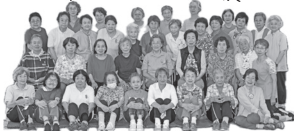
「元気いっぱい うえがはら健康クラブ」の皆さん