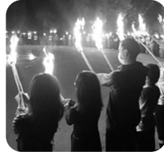
全員で作った炎の輪