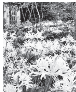
伊東先生が植えた白いヒガンバナが咲きます

「この庭との出会いは?」 12年前の冬、3年間空き家になっていた元伊東小児科の診察室と庭の部分の借り手を探している... オープンガーデン(ガーデンアトリ葉守)を始めたのは?