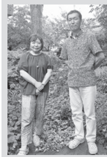
ムクロジの木の前で

「この庭との出会いは?」 12年前の冬、3年間空き家になっていた元伊東小児科の診察室と庭の部分の借り手を探している... オープンガーデン(ガーデンアトリ葉守)を始めたのは?