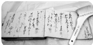
はけでごみを取り除いた資料

トライやる・ウィークで、西宮や地域のことをたくさん知ることができて貴重な体験になりました。