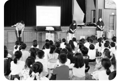
最後まで真剣に耳を傾ける子どもたち

夏休み前の、これから行動範囲が広がってくる3年生にとって、とても有意義な時間となりました。