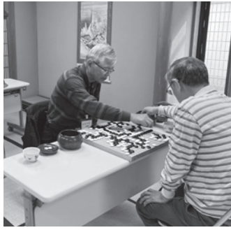
真剣勝負が続きます