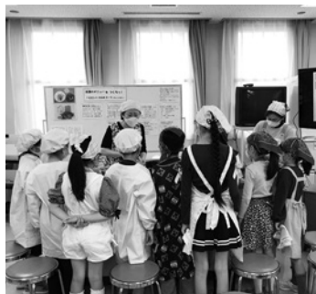
どうやって作るのかな?

子どもたちは「自分で作ったピビンバはおいしかった」「準備から後片付けまで楽しかった。お母さんに教えたい」「みんなと一緒に作れてうれしかった」など、大満足な様子でした。 (参加10人)