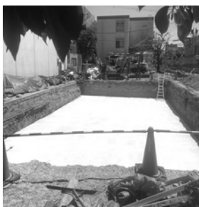
体育館南側の駐車場の下には雨水貯水槽（5月5日撮影）

体育館の周りも外構整備中。年明けに植栽工事が終わると、5年にわたる校舎改築工事が完了します。