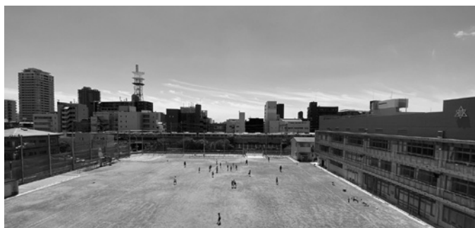
北校舎屋上から見た校庭全景。東側に総合遊具、南側に鉄棒が見えます

体育館の周りも外構整備中。年明けに植栽工事が終わると、5年にわたる校舎改築工事が完了します。