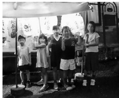
現在の地蔵盆の様子