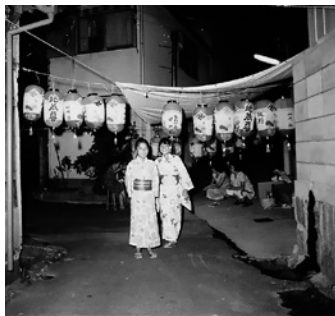
昭和50年代の地蔵盆の様子