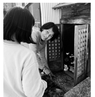
小学生との話が弾みます