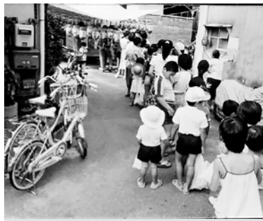
昭和50年代の地蔵盆の様子。お菓子が配られるのを並んで待つ子どもたち