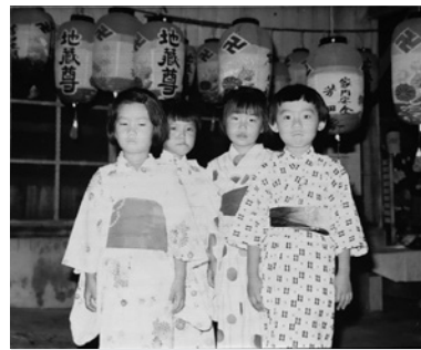
昭和50年代の地蔵盆の様子