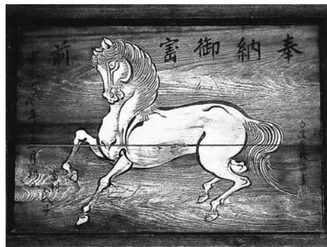
安永2年(約250年前)に奉納された神馬図

た馬の像や絵を描いた板を奉納するようになります。室町時代になると、大絵馬、神様の御姿や持ち物、眷属(神の使い)、などさまざまな絵が描かれるようになります。