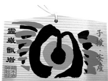
ご神体・巖を描いた安産祈願絵馬