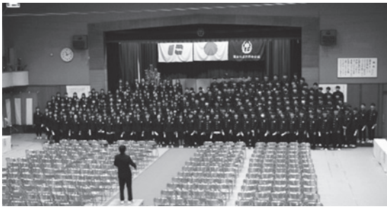
卒業生がステージに上がって大合唱。思い出があふれて、大号泣の生徒も！

入学時はコロナ禍でのスタートでしたが、徐々に日常生活を取り戻し、充実した学校生活を過ごした生徒たち。たくさんの経験と思い出が、大きくりんとした立ち振る舞いに現れており、3年間で大きく成長した姿に感動しました。