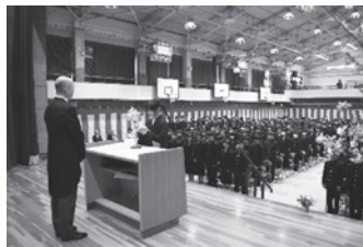
入学生代表のあいさつ