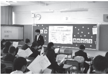
どんなクラスかな？ ドキドキ

新たな仲間や先輩との出会い、勉強、部活、行事と、3年間でワクワク、ドキドキ、ズキズキなど、いろいろな出来事を経験して心身ともに大きく成長していくことでしょう！