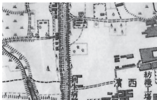
二万分の一地形図（大正時代の西宮）から

現在の教育文化センターは市立中央図書館、市立市民ギャラリー、市立郷土資料館と西宮市平和資料館の4施設で構成されています。 市立図書館は昭和3年、現在の市役所南側に建設。昭和40年、市民会館建設のため、現在の市役所南館がある所に移転しましたが、昭和60年に閉館。その後、現在の中央図書館が開館しました。 中央図書館では清酒、福神関係資料の他、開館当初からの新聞、明治から昭和初期の雑誌創刊号を集めた秋山コレクションといった貴重な資料を所蔵しています。 市民ギャラリーは、美術に関する創作活動の奨励と普及を図り、美術を通じて市民文化の一層の向上に寄与することを目的に開設されました。 郷土資料館は、西宮地方の歴史と文化財を実物資料で知ることが出来る施設です。満池谷層の植物遺体包含層（標本）、具足塚古墳出土品、江戸時代の宿駅生瀬の家並模型、明治・大正・昭和初めの香櫨園、苦楽園、甲陽園の絵はがきなどを常時展示しています。