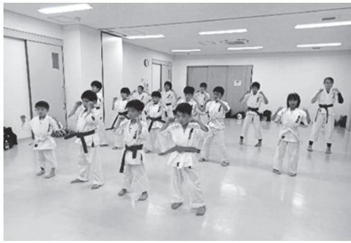
気合いを入れて！押忍！！

空手を通して礼節を学び、心 「清く、正しく、元氣よく」 わせた稽古を行っています。 に練習に打ち込むことができ が未経験からでも安心、安全 まで、幅広い年齢層の人たち 道場では幼稚園児から大人 や演武に挑戦しています。