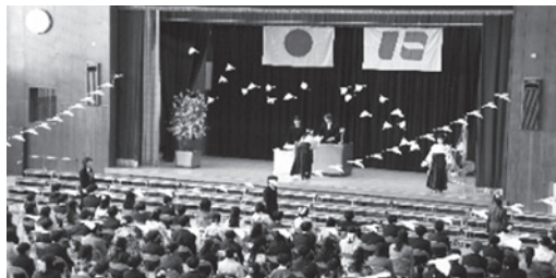
卒業証書を受け取る卒業生

期待と不安 を背負って次 の世界へ飛び 出していく子 どもたち。緊 張感を持ち無 駄のない動き で卒業証書を 受け取る姿は、