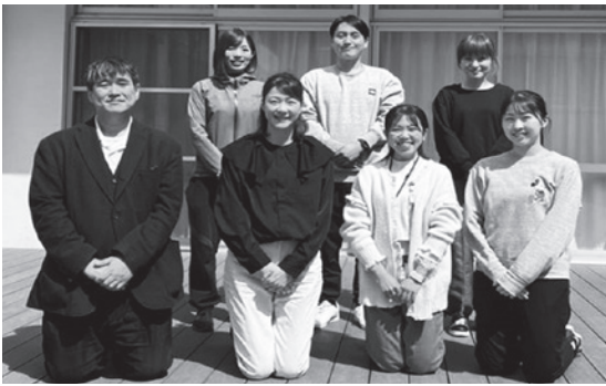
これからよろしくお祈りします