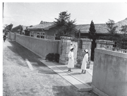
昭和30年代の夙川病院