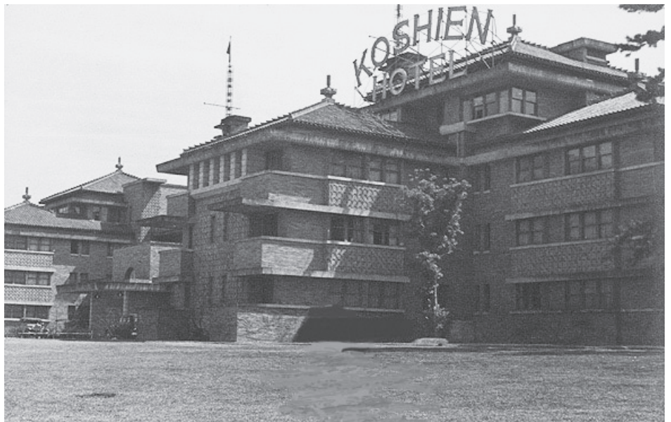
↑開業当時の外観(建物北側)。省線甲子園口駅から「KOSHIEN HOTEL」のネオンサインが見えたそうです

第2次世界大戦中の昭和19年には、海軍病院に転用されました。ロビーのシャンデリアなど、鉄を使った製品は軍に徴収されたそうです。終戦後は米軍将校宿舎に転用され、内部にかなり手を加えられて全く違う姿になっていたようです。