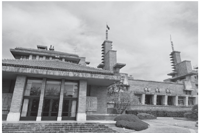
↑現在の外観(建物南側)