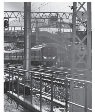
5丁目のトンネル横にある鉄道ファンに人気のスポット。電車を眺める親子をよく見かけます!