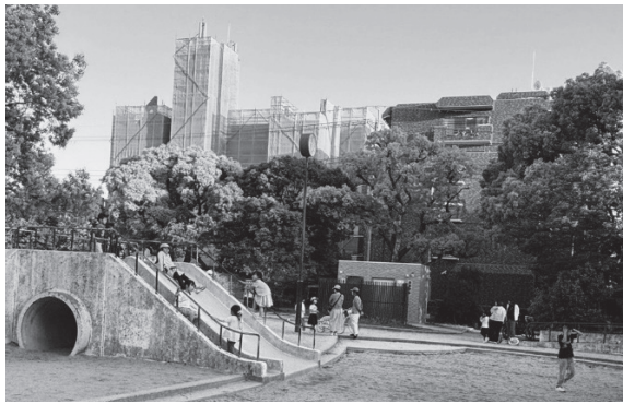
ゴールデンウィーク中の御代開公園。 たくさんの親子連れでにぎわっていました!