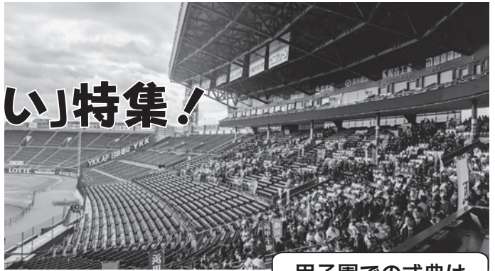
甲子園での式典は宮っ子だけ!

今年も二十歳のつどいを取材しました。当日は曇り模様でしたが、雨も降らず、時々日が差し込む天気でした。阪神甲子園球場で開催された身が引き締まる冬の式典。若者たちの晴れ姿をご覧ください。