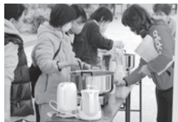
おしるこの炊き出し