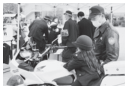
ミニ制服で白バイ体験