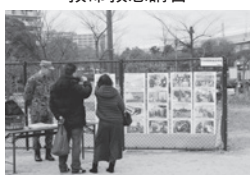
自衛隊の展示パネル