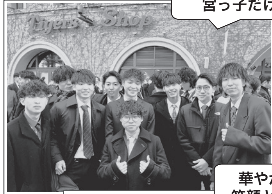
華やかな笑顔と着物