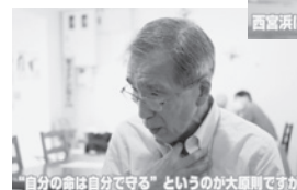
「自分の命は自分で守る」というのが大原則です