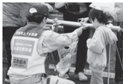
断水に備えた給水訓練