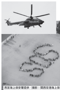
西宮海上保安署のヘリから人文字を空撮