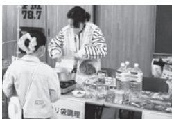
ローリングストックとポリ袋調理