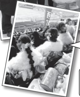
阪神タイガース・佐藤輝明選手からメッセージが!