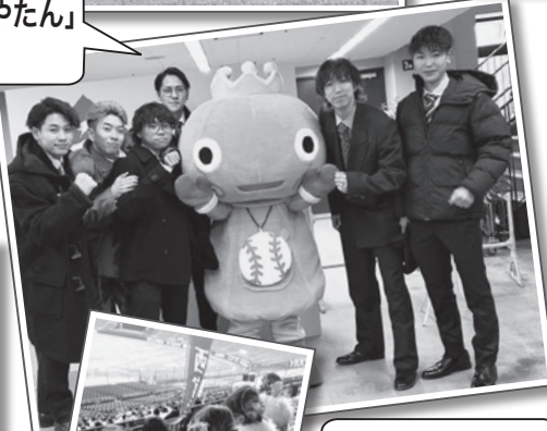
後ろ姿もバッチリ!