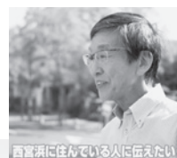
西宮浜に住んでいる人に伝えたい