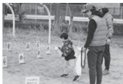
ペットボトル消火ゲーム