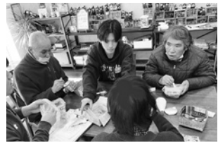
お味はいかがですか?

災害時に備えよう 地域共生館ふれぼの 1/29 地域防災について研究している関西学院大学・関嘉寛教授のゼミ生が、「防災ワークショップ」として、簡単に作れる非常食を紹介しました。 まず、牛乳パックを切り取ってスプーンの形に。チラシを折って箱にして、それにビニール袋を掛けて皿を作りました。 この日のメニューは、切り干し大根とツナ缶をマヨネーズとコショウであえたサラダと、「じゃがりこ」にチーズを割いて入れ、お湯でかき混ぜたポテトサラダの2品でした。 もしものときに覚えておきたいですね。(参加20人)