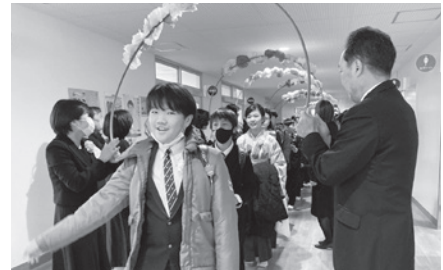
花のアーチをくぐる卒業生