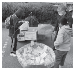
おもちゃ釣りのコーナーも

手作り品や子ども服、コーヒー、パンや野菜の販売の他、駄菓子屋さんや缶バッジのコーナーなどが出店。バルーンアートも登場し、赤ちゃん連れから高齢者まで、ワイワイガヤガヤ。最後は寒さを吹き飛ばそうと、ラテン音楽に合わせてみんなで踊って盛り上がりました。