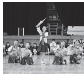
子どもたちが民族衣装をまとうと、軽やかな舞を披露しました

最後に、和太鼓と朝鮮太鼓との違いを教わり、音楽部が朝鮮太鼓『チャンダンノリ』を演奏。地響きのように伝わる太鼓の音に迫力を感じました。