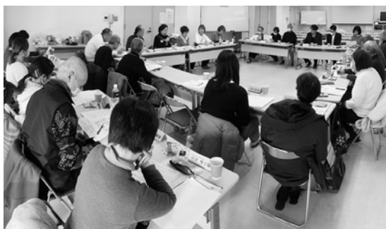
参加者から活発に意見が出ました

・安井地域の人口増減は少なく、年齢構成で見ても次世代の担い手候補はたくさんいる。誰かの役に立ちたいと思っている人も一定数いるはず