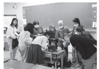
パソコンを使って説明する子どもたち