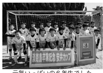
元気いっぱいの6年生でした

淡路島卒業記念安井カップ2024* 淡路島青少年交流の家 3/2・3 安井サッカークラブ初優勝! 今年は西宮市と神戸市、淡路島の12チーム220人が参加しました。 主催しているものの、これまで優勝を逃していた安井チームでしたが、9年目にして念願の初優勝! 卒業を前に素晴らしい思い出になりました。 *平成28(2016)年からスポーツクラブ21安井ジュニアサッカー部が淡路島で開催している大会