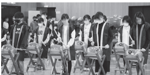
和太鼓クラブの演奏(写真上)とソーラン節の演技