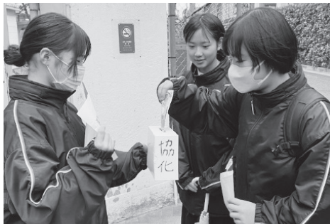
募金にご協力ありがとうございます！

「募金活動をしようと思っただけは何ですか？生徒会で活動していくにあたり、元日に石川能登・北陸地震のニュースを見て、被災地の人たちに対して「今、私