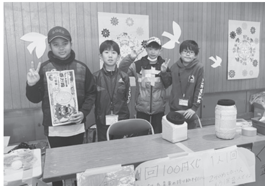
豪華賞品がたくさん! くじ引き

実行委員のがんばり、保護者のサポート、外部団体の協力でカーニバルは大盛況のうちに終了しました。