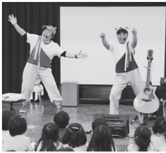
保育士ユニットかば☆うま

浜脇幼稚園は、2月19日に幼稚園とPTA共催で、あそびうたユニットの「かば☆うま」を招いて、「かば☆うまコンサート」を開きました。園児や保護者以外にもきりん組や近隣の親子などたくさんの方が参加し、楽しいひと時を過ごしました。 「かば☆うま」は男性保育士ユニットで、関西を中心に活動されています。 「こちよこちよでんしゃ」「わらえたらだきしめて」など、オリジナルの楽曲がとても人気で、今回のコンサートでも披露して、とても盛り上がりました。