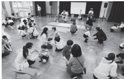
親子で手をつないで遊ぶ『めりーGOらんど!』