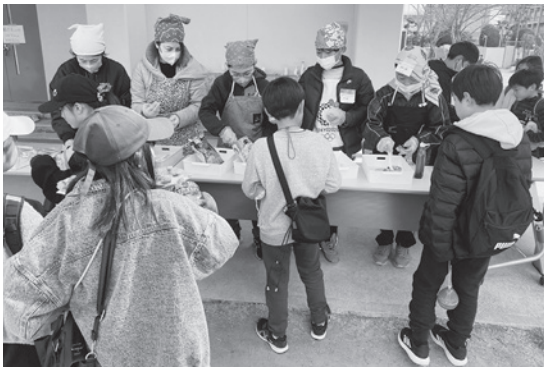
たこせんおしそつ!