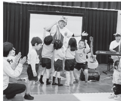
宝探し遊びのお題は赤い服の人。うまちゃんをタッチ!