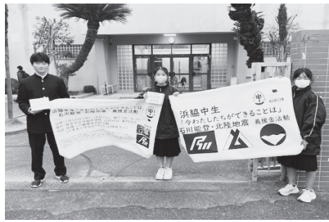
「今、私たちにできることは」

1月15、19日の間、石川県・能登半島地震の被災地を支援しよう！と、浜脇中学校の生徒会が企画し、生徒会本部役員と有志が募金活動を行いました。