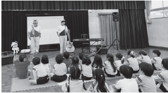
わくわくしながら話を聞く子どもたち。 これから楽しい遊びが始まります