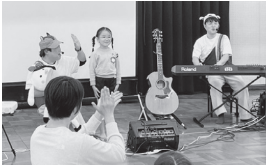
あそびうたでうれしそうに答える園児

浜脇幼稚園は、2月19日に幼稚園とPTA共催で、あそびうたユニットの「かば☆うま」を招いて、「かば☆うまコンサート」を開きました。園児や保護者以外にもきりん組や近隣の親子などたくさんの方が参加し、楽しいひと時を過ごしました。 「かば☆うま」は男性保育士ユニットで、関西を中心に活動されています。 「こちよこちよでんしゃ」「わらえたらだきしめて」など、オリジナルの楽曲がとても人気で、今回のコンサートでも披露して、とても盛り上がりました。