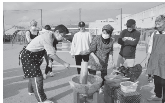
均一につくのは大変だけど楽しいです