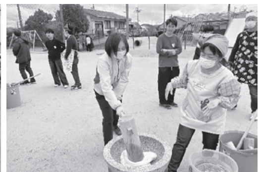
合いの手を入れながら力強くついていきます！