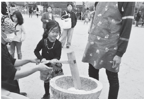
餅つきは楽しいな♪