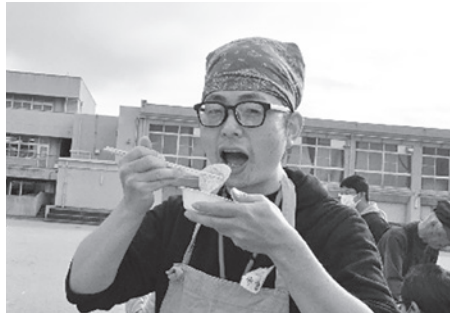
きなこ餅おいしい～