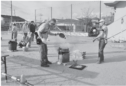
次々ともち米を蒸しています