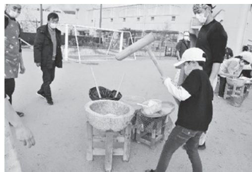
きねを振り上げてべったん、べったん