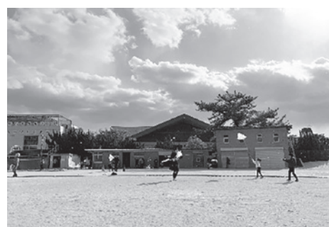
天高く舞い上がれ！

長年この場所ですべてをやらせてもらって今まで1回だけ中止がありました。その時は雪で中止になりました。それ以外は全部ここで開催しています。