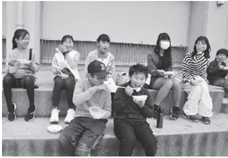
おいしい餅をみんなで食べてにっこり♪