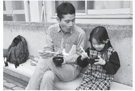
親子で餅をいただきます