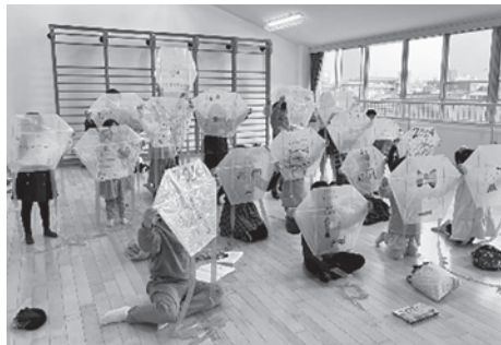
大社児童センターでたこ作り

西宮中央運動公園陸上競技場で、第45回大社地区たこあげ大会が1月13日に開催されました。当日は参加者約300人。小さな子どもからおじいちゃん、おばあちゃんまで、たこ揚げを楽しみました。