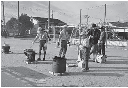
3台のかまどが用意されました♪