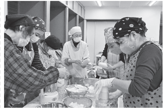
餅の準備。これは大根おろし

昨年12月16日、大社小学校の校庭でもちつき大会が行われました。 当日は、ボランティアを含めて約900人の参加者で、餅をついたり、出来立ての餅をいろいろな味で食べ、みんなにっこりでした！