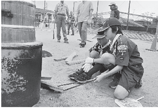
火加減に気をつけて蒸しています