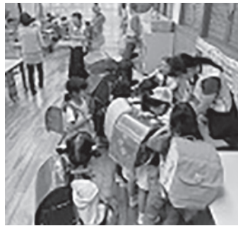
「こんにちは」見守りサポーターが受け付け

西宮市と市・教育委員会は、放課後の学校施設などを利用し、子どもの自由な遊び場や学びの場を提供する「放課後キッズルーム事業」を進めています。 大社小学校でも「大社っこ広場・大社っこルーム」の名称で、昨年6月から始まりました。