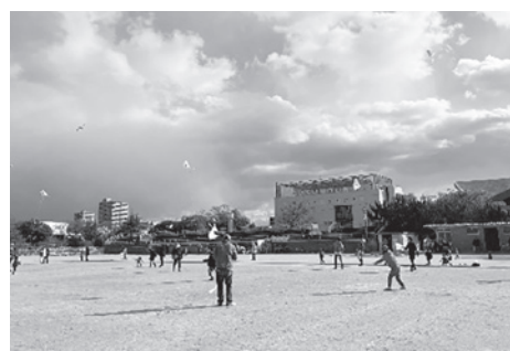
強風でよく揚がりました

●来年度から、西宮中央運動公園再整備事業に伴い、陸上競技場が使用できなくなります。来年のたこあげ大会は開催未定ですが、どこかで開催されることを願います！