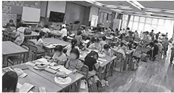
何して遊ぶのかな。宿題もやろうかな

参加する子どもたちは、1日平均50人ほどで、主に低学年が多く、ランチルームで宿題をしたり遊んだり、運動場では鬼ごっこやボール、縄跳びなどで自由に遊んでいます。 また、季節に合わせて企画