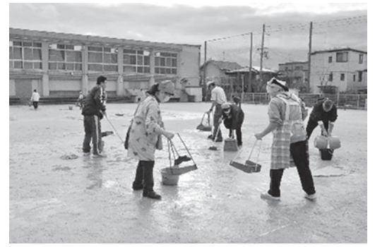
朝まで雨だったので、水たまりをとっています