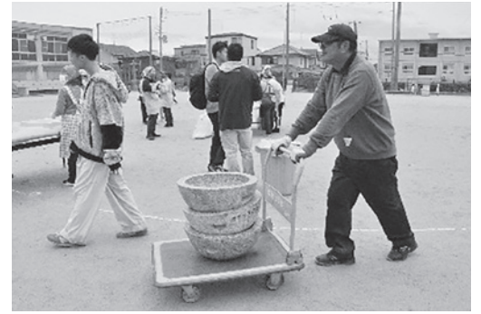
臼を校庭に運んでいます